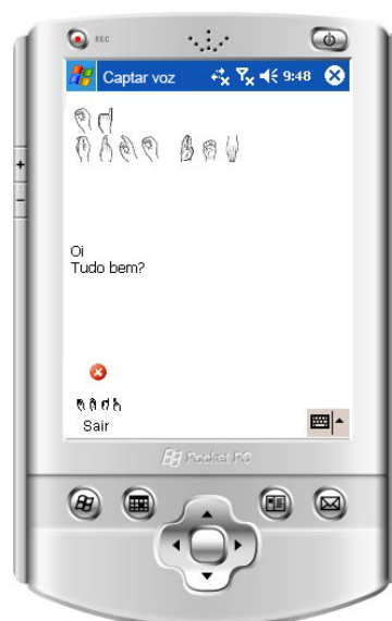
Figura 3: Módulo Comunicação.

Por fim, além de o sistema auxiliar o aluno durante todo o processo de alfabetização disponibiliza, ele também o acompanha ao longo de sua vida, auxiliando-o no processo de interação com a sociedade, através, principalmente, de dispositivos móveis. Por exemplo, enquanto um deficiente auditivo ou surdo estiver utilizando o sistema ao se comunicar com um ouvinte, tudo o que está sendo dito pelo ouvinte aparece para o deficiente auditivo ou surdo, em seu dispositivo, em Libras e em forma de texto na Língua Portuguesa, como demonstrado na Figura 3.