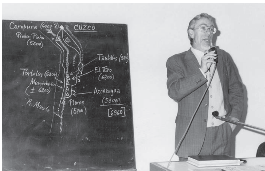
Figura 4. J.S. en el VIII Congreso Nacional de Arqueología Argentina (Concordia, 1985).

J.S.: Exactamente. Es prácticamente el único indicio de lo que va más allá del ámbito de lo económico y lo tecnológico y que puede llevarnos hacia los temas religiosos, en los cuales se engancha algo que estoy estudiando actualmente que es el tema del chamanismo. Yo creo que para el Noroeste argentino hay tantos sitios, motivos y personajes con cabezas, aureolas y figuras, aparentemente chamanes, acompañados por aves y serpientes que, verdaderamente pienso que ahí hay algo de eso. Creo que ésta es una buena hipótesis que también está tratando la Dra. Ana María