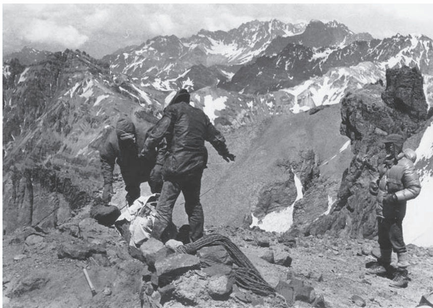
Figura 5. Dos expedicionarios preparan el fardo funerario de la momia del Cerro Aconcagua para su ulterior descenso (29 de enero de 1985 [J.S. a la derecha])

R.B.: ¿Usted ya era andinista o se hizo?