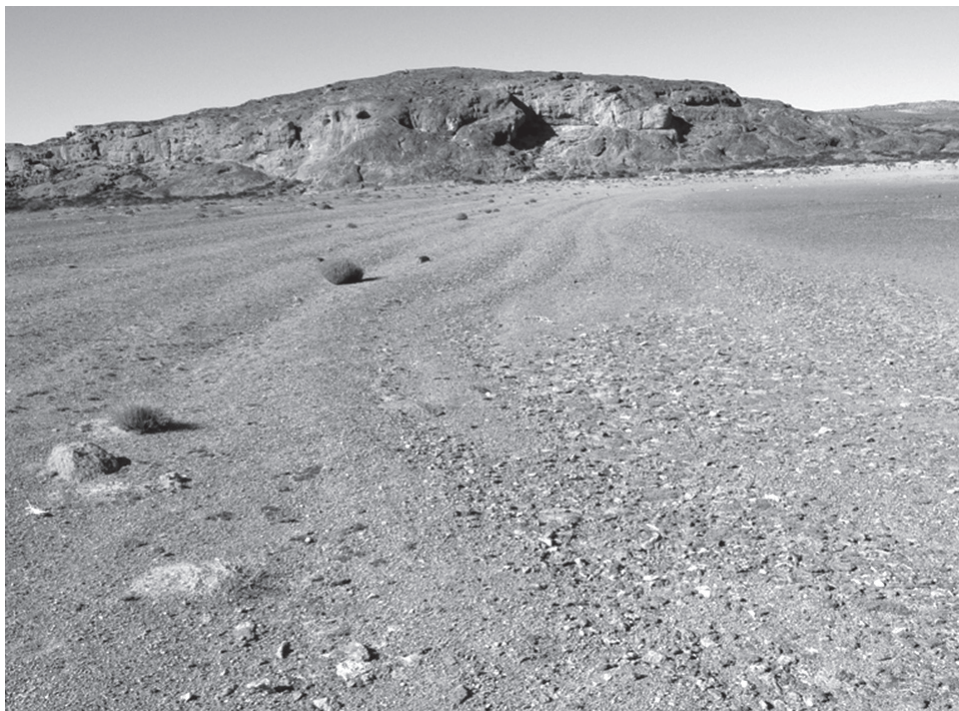
Figura 2. Vista de niveles antiguos de la laguna 2. Al fondo puede verse la pequeña cueva sondeada.

Ambas lagunas han tenido variaciones en su disponibilidad de agua, tal como atestigua la presencia de ramas y troncos en los bordes de la laguna 1 (Franco y Cattaneo 2009) -que marcan la línea de resaca- y de antiguas líneas de costa de la laguna 2 (figura 2). En proximidades de las mismas se realizaron muestreos de materias primas, transectas, sondeos y relevamientos de arte rupestre.