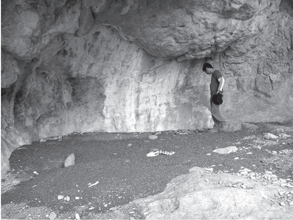
Figura 3. Vista del interior de la cueva 1 de la laguna 2, La Gruta.

cercana, a la que en la actualidad se acercan los guanacos ( Lama guanicoe ). En un sondeo inicial se obtuvo un fechado de 10656 \pm 54 años AP (AA76792) (Franco y Cattaneo 2009).