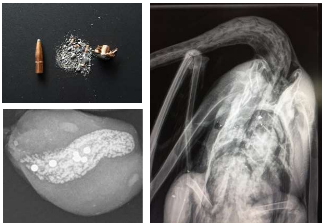
Figur 1. Øverst til venstre: Riffelprojektiler af bly splintres ved gennemtrængning af byttet. Hermed frigives en stor mængde blyfragmenter med risiko for forgiftning af ådselædere og andre konsumenter. Billedet viser et almindeligt blyprojektil før og efter træf. Til højre: Fordeling af projektilfragmenter i knopsvane skudt med bly-riffelammunion. Nederst til venstre: Fasankråse med 6 ædte hagl, heraf 4 stål- og 2 blyhagl.

Når blyhagl indskydes i kroppen på et dyr, afsættes der et spor af mikroskopiske stumper metal i kød, bindevæv, organer, blod og knogler. Hagl kan være indlejret i dyr, der efterlades i naturen (anskudt og mistet vildt) og kan hermed optages af ådselædere. Det samme kan være tilfældet, hvor fugle (typisk vandfugle, men også terrestriske arter) via føde eller kråseflint æder blyhagl, som er spredt via jagt (Figur 1). Klassiske riffelprojektiler af bly er konstrueret til at gå i stykker under passagen af vildtkroppen for at øge dræbeevnen (Figur 1).