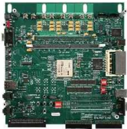
Figura 2. Virtex II Pro Developer System con una FPGA Virtex II Pro.

Se cuenta con dos placas de desarrollo, una Virtex II Pro Developer System con una FPGA Virtex II Pro modelo XC2VP30 (Figura 2), y una Spartan 3 Starter Board con una FPGA Spartan 3 XE35200 (Figura 3). Además, de las herramientas del fabricante: EDK (Embedded Development Kit) y el ISE (Integrated Software Environment) Foundation (Figura 3). Una computadora con un sistema operativo GNU/Linux Debian Etch con un kernel2.6.18-4 estable.