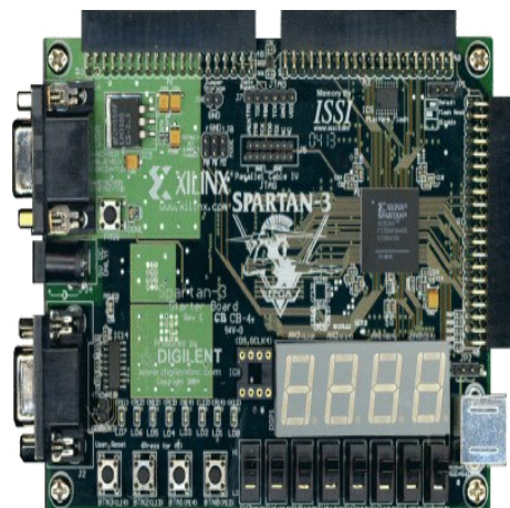
Figura 3. Spartan 3 Starter Board con una FPGA Spartan 3.