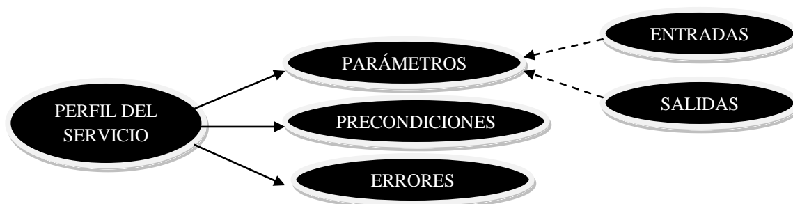
Figura 2- Información del perfil a utilizarse en el registro de servicios

Con ésta información de errores, el consumidor podrá, ante la presencia de dos o más servicios que satisfagan sus requerimientos funcionales; optar por aquel que ofrezca una mayor cantidad de errores tipificados, a fin de poder brindar una mayor robustez a la hora de consumir el servicio. Es decir el consumidor analizará los mensajes de errores soportados por el servicio y los comparará con su rutina de manejo de errores, para analizar sobre cuál de los servicios ofrecidos dispondrá de un mayor control ante un eventual mensaje de error. El criterio para la selección del servicio será definido por el cliente, por ejemplo, puede basarse en la cantidad de errores controlados que el servicio puede disparar o puede darle mayor importancia al control de determinados errores, e incluso exigir como requisito para la selección de un servicio que se informe un tipo de error determinado considerado de máxima importancia.