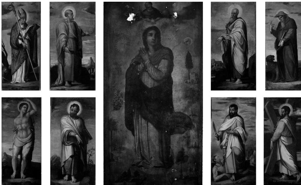
Antonio de Alfián: Inmaculada y santos . Sevilla, Parroquia de Santa Ana.

Quizá el alcance estético de la pintura de Alfián no iguale al de los artistas de primera fila en el panorama pictórico español del Quinientos, y ni siquiera en el hispalense, pero sí representó un papel de gran relevancia en la economía artística y en la producción de imágenes en el ámbito de la ciudad y su extenso arzobispado. Disfrutando de una de las trayectorias vitales más prolongadas entre los pintores de su siglo y una actividad incesante durante 60 años, desde su primera noticia por ahora conocida en 1539 9 hasta 1601, cuando Pacheco y Diego Gómez, que se hacían cargo de una obra concertada por Alfián con anterioridad, lo declaran “tan viejo que ya no pinta” 10 , su nombre es uno de los más recurrentes en los archivos hispalenses de la segunda mitad de la centuria, interviniendo en un sinfín de obras de toda índole: pintura de lienzos y guadamecés, retablos, pintura mural, dorado y policromía de altares e imágenes... En el campo de la retablistica, que constituye la parte del león de su producción, intervino en no menos de cincuenta y cinco retablos o tabernáculos, solo o en colaboración con otros pintores, un número que probablemente no tiene paralelo en ningún otro pintor de su siglo en la ciudad. No hay duda de que, antes de la alusión de Pacheco y Gómez, Antonio de Alfián pintó mucho, e intensivamente, en Sevilla.