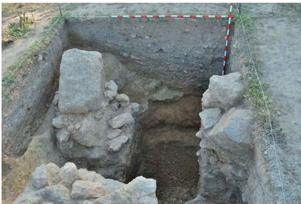
Figura 4. Fotografía general del corte 20.

La última fase de ocupación documentada en el corte 20 arranca en el año 1981, como resultado de las viviendas provisionales que se levantaron en el yacimiento a causa de unas graves inundaciones que se produjeron en la zona. Asociada a este hábitat, del que quedan restos visibles hoy día, encontramos la fosa 20005/20099, que ocupaba el ángulo noroeste del corte 20, rompiendo la fosa de época antigua.