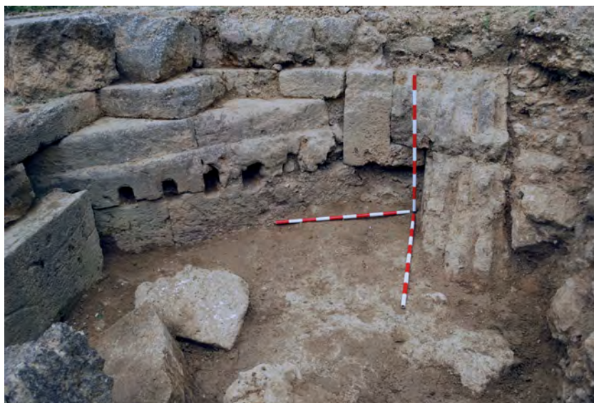
Figura 13. Hilada de mechinales del corte 12.