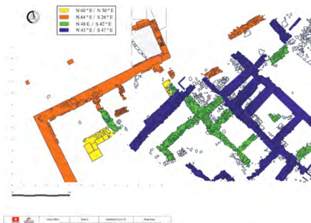
Figura 6. Planta final de los cortes 10 y 13, en la que resaltan las distintas fases constructivas.

Asimismo, en función de la orientación de los muros podríamos hablar de, al menos, cuatro fases. Dos de ellas, quizá las más antiguas –con grandes reservas podríamos fecharlas sucesivamente, por los materiales arqueológicos, en los siglos VII-VI a. C. hasta tal vez época tardopúnica–, tienen una orientación muy parecida: N 48° E (color verde) y N 43° E (color azul). Las otras dos fases tienen, a su vez, una orientación similar entre ellas: N 64° E (color naranja) y N 60° E (color amarillo), y la primera podría ser la más tardía, enlazando ya con construcciones de época romana que se le superponen, de acuerdo con los datos suministrados por el corte 13 (fig. 6).