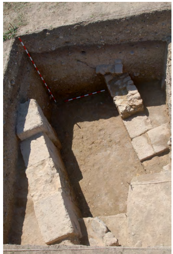
Figura 10. Fotografía general del corte 14.

El espacio entre ambos sistemas de estructuras, cuya relación entre sí no está clara, lo ocupa un relleno de varias unidades estratigráficas, las UE 14017 y 14015, que contenían abundante material de construcción, como placas de mármol y numerosos fragmentos de mosaicos con unas teselas blancas o blancas y negras, con material cerámico romano de época imperial. Quizá se trate del mismo proceso de relleno documentado en el vecino corte 13. La aparición del nivel freático en la UE 14017 impidió continuar la excavación estratigráfica y conocer la datación de ambos sistemas de muros (fig. 10).