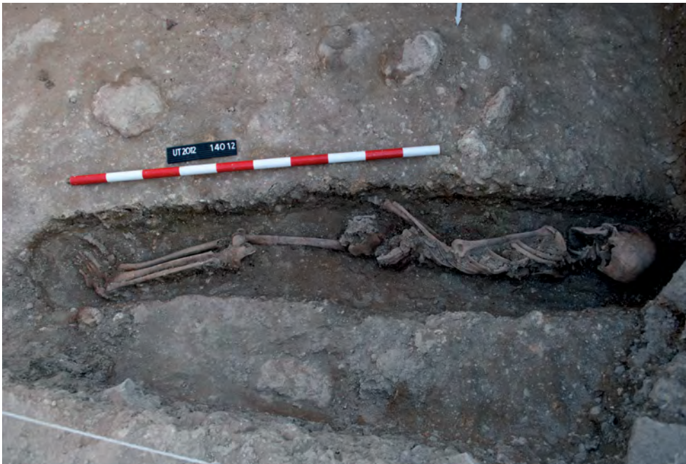
Figura 11. Inhumación 14014 de individuo femenino adulto en posición decúbito lateral derecho.

En época tardoantigua o altomedieval, en el nivel de arrasamiento del muro 14009, se dispusieron dos sepulturas, 14013 y 14014. La primera no se excavó, dejando un testigo con los restos del cadáver, pues la mitad de la sepultura se situaba fuera del corte 14. La segunda pudo excavarse en su totalidad y consiste en una tumba de fosa muy estrecha, con los laterales señalados a veces por pequeñas lajas; alojaba un esqueleto en posición decúbito lateral derecho, perteneciente a un individuo femenino adulto. Seguramente estas sepulturas forman parte de la misma necrópolis tardía documentada en el corte 13 (fig. 11).