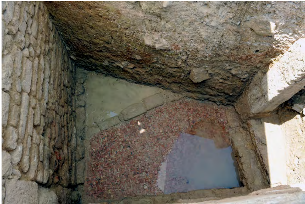
Figura 7. Suelo de opus figlinum 13015.

El corte 13 queda claramente separado del corte 10 por un muro de terraza (UC 10010) que establece niveles de ocupación a dos cotas, separadas por algo más de tres metros de altura entre los niveles de circulación de la terraza inferior respecto a los de la terraza superior. La zona más profunda y más antigua registrada pudiera estar compuesta por un espacio de circulación con un suelo (13015) de opus figlinum , también conocido como opus punicum por su amplia representación en el norte de África (Ginouvès y Martin, 1985: 151). Este suelo ocupaba la práctica totalidad del sector, salvo en la zona norte. Los depósitos asociados a estos suelos no han podido ser excavados por encontrarnos por debajo de la capa freática; su datación, pues, es difícil (fig. 7).