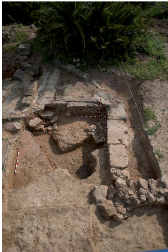
Figura 14. Fotografía general del corte 11.

Se ha conservado, aunque mínimamente, un pavimento perimetral, sobre un pavimento anterior de mortero de cal, realizado con pequeñas teselas de mármol (suelos 12003 y 11037), probablemente contemporáneo al edificio excavado en el corte 11. Otra subfase de uso de la estructura está definida por las UC 11036, UC 11038 y el pavimento de mortero de cal 11029, que conforman una habitación de forma triangular destruida en su ángulo meridional (fig. 14).