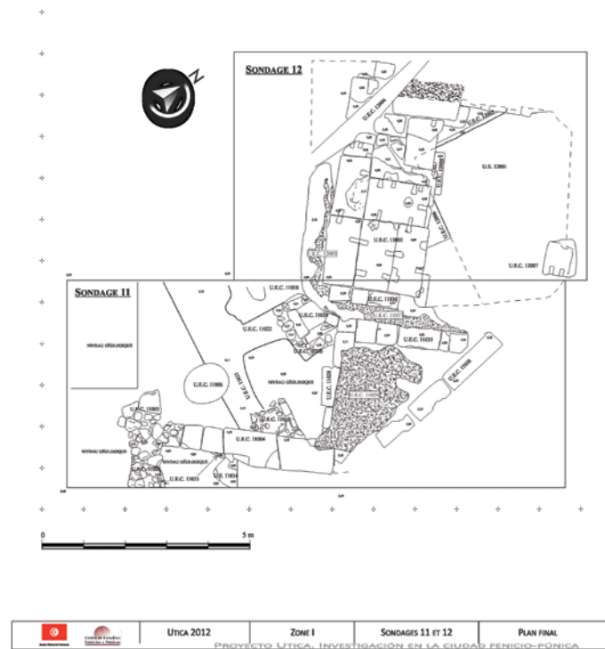
Figura 12. Planta final de los cortes 11 y 12.

De esta misma fase es una estructura hidráulica muy destruida, quizás una cisterna (UC 11018) situada junto a la cara oeste del pozo. Tanto el pozo como la estructura hidráulica presentan una orientación similar a la de la gran estructura de sillares de la primera fase del corte 12 (muro 12005 y muro 12006), por lo que podría tratarse de instalaciones integradas en un edificio de carácter monumental relacionado con la captación, distribución o uso de las aguas termales que manan en las inmediaciones (fig. 12).