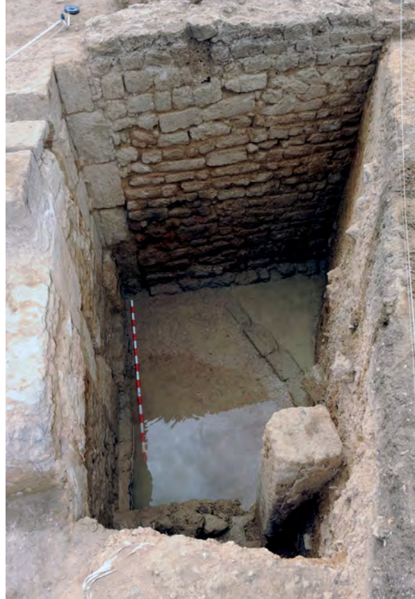
Figura 8. Fotografía general del corte 13.

La terraza más reciente definida por el muro 10010 estaba compuesta por una serie de estancias cubiertas con un sistema de vigas que apoyarían desde el arranque superior del muro de terraza hasta pilares situados en la fachada más septentrional, utilizados posiblemente al mismo tiempo como soportes de la estructura de cubierta y como jambas, al igual que la puerta de acceso 13019, abierta a una calle que discurría en sentido este-oeste.