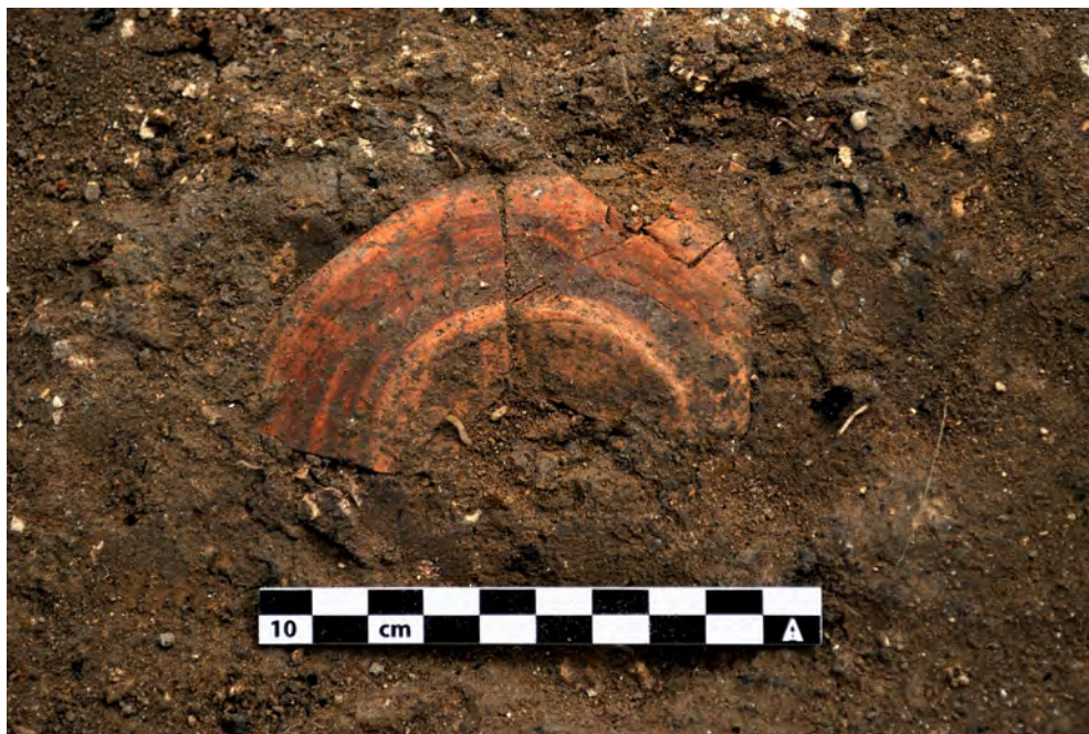
Figura 3. Cerámica de importación fenicia oriental localizada in situ en el relleno del depósito 20017.

Uno de los rasgos característicos de este depósito (UE 20017) es su formación aparentemente continuada, hecho que ha podido ser documentado gracias a la presencia de material cerámico in situ y huesos de animales en conexión anatómica (fig. 3).