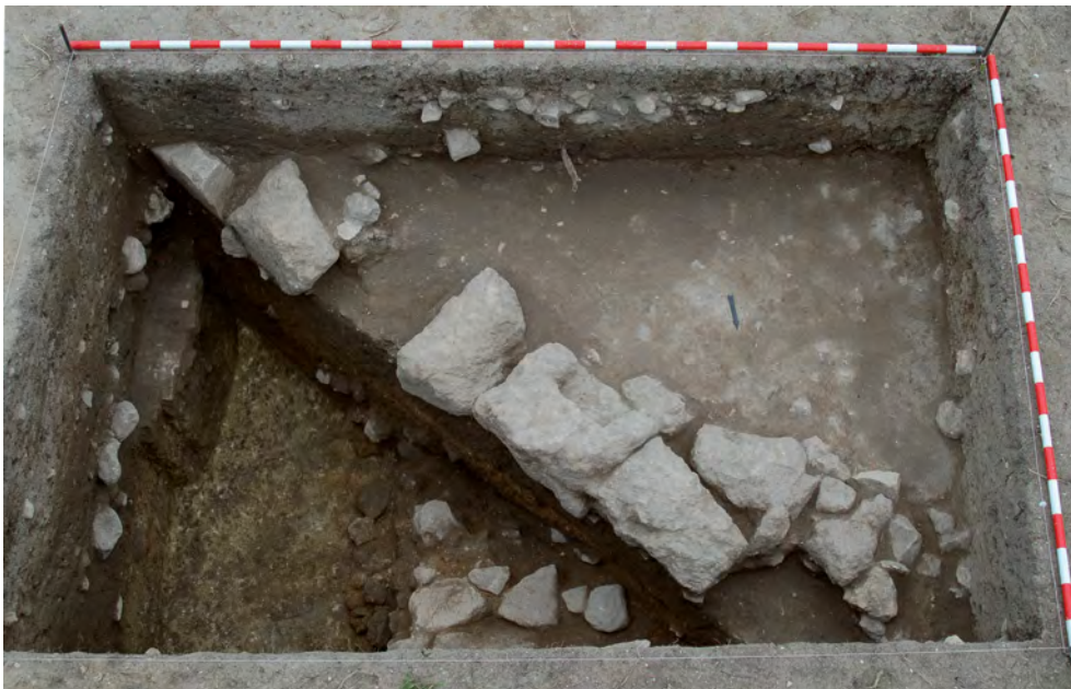
Figura 15. Fotografía general del corte 30.

La orientación del muro 30008 es suroeste-noreste (N 45° E), quizá la misma del pavimento de cerámica 30006, que conformaría una fase constructiva más reciente, posiblemente en uso hasta época bajoimperial, amortizado por el estrato UE 30005, datable seguramente en esa misma época (fig. 15).