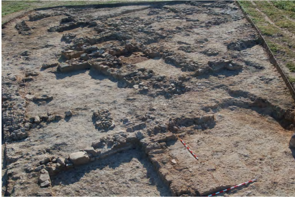
Figura 5. Fotografía general del corte 10.

el muro de terraza romano (UC 10010) que atravesaba la mayor parte del sondeo desde el suroeste al noreste y se configuraba como la estructura más importante. A su vez, observando que la mayor parte del entramado urbano se desarrollaba hacia el este y sureste, se planteó una última ampliación de otros 5 metros hacia la zona oriental, con objeto de definir mejor las distintas estancias de la zona abierta inicialmente. Tras incorporar ambas ampliaciones quedó delimitada finalmente una extensión de excavación de 15 × 25 m que cubría una superficie total de 375 m 2 (fig. 5).