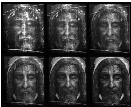
Figura 1 Secuencia de modelado del rostro adaptado a la Síndone.

mente por la imagen de la Síndone. De este modo las partes miológicas se van insertando en los lugares óseos correspondientes, y así evitar el error cometido por el equipo que realizó el proyecto de la Universidad de Manchester.