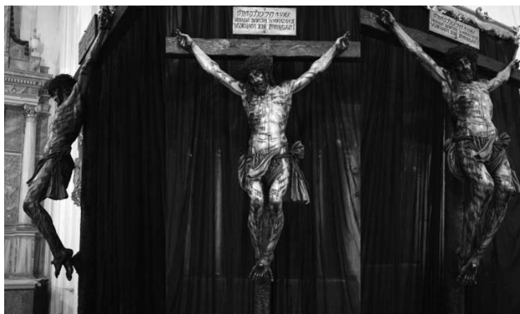
Figura 5 Proceso de policromía de las heridas.