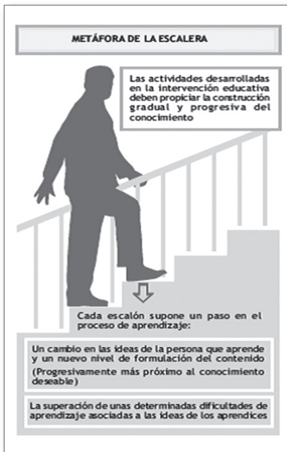
Fig. 1. García, Rodríguez-Marín y Solís (2008: 25).