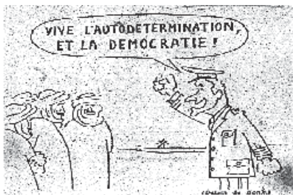
Fig. 3. Viñeta en Le Monde , 4 de noviembre de 1975, p. 1

La tercera hace referencia a la visita de don Juan Carlos al Sahara a principios de noviembre de 1975 y en ella aparece vestido de uniforme en el desierto frente a varios saharauis sonrientes. De su boca sale un bocadillo que reza “Vive l'autodetermination et la démocratie” 40 .