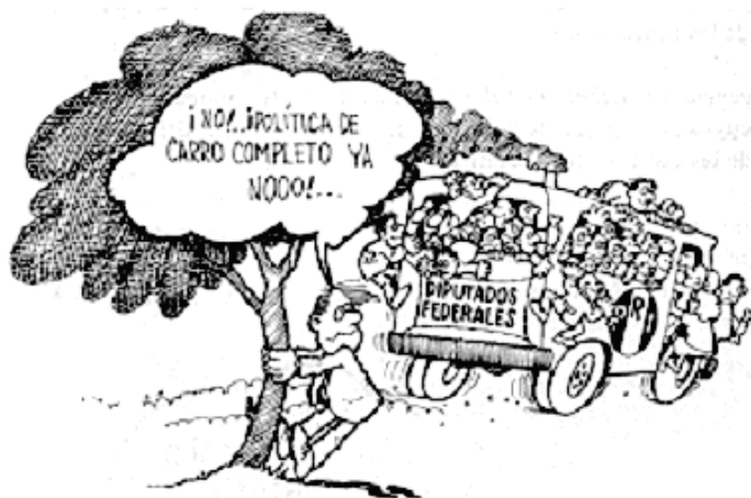
Ilustración de José Duarte en Prawda , 1987.

A pesar de todo lo anterior, López Portillo necesitaba no dejar de voltear al pueblo y en este sentido inició la reforma política que permitió por primera vez en el país (en 1982 al término de su mandato) que contendieran a la silla presidencial nueve partidos y siete candidatos. De cualquier forma el sistema no estaba dispuesto a moverse un ápice para repartir el poder, la sombra del fraude electoral apareció y el PRI ganó 299 de los 300 distritos electorales.