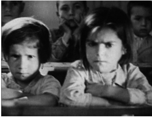
Figura 1. La mirada a la cámara de los escolares de Tierra sin pan ofrece un contraplano directo del horror. De esta forma al menos lo concibe Godard cuando recupera esta imagen para su filme De l'origine du XXIe siècle .

pela igualmente a los espectadores. En el filme de Godard, estos escolares conviven con un catálogo de imágenes espeluznantes: un auténtico mural del horror que incluye cadáveres famélicos tirados en las cunetas, ahorcamientos, familias y grupos de personas que huyen de la guerra, violaciones, torturas y vejaciones de todo tipo. Su recuperación en este entorno es, sin embargo, plenamente pertinente, en tanto el montaje godardiano ofrece en contraplano la descarnada constatación gráfica de lo que Buñuel vislumbró en la pobreza extrema de estos niños y, sobre todo, en la indiferencia general que en pocos años desembocaría en la barbarie.