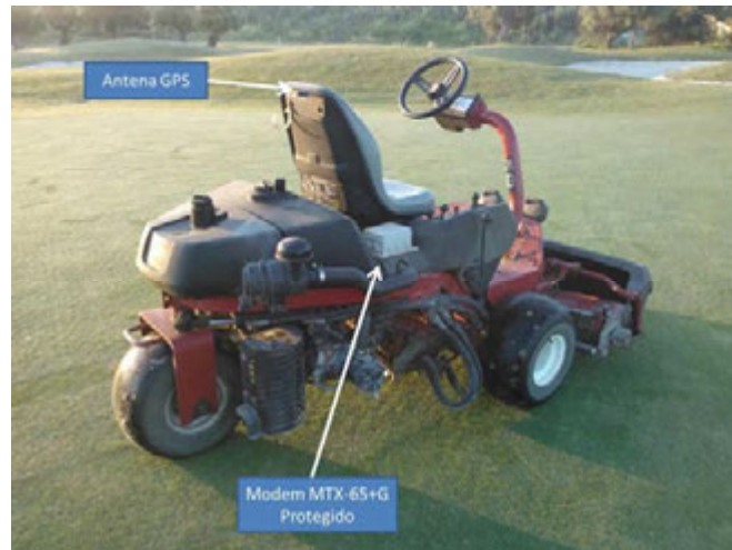
Figura 1. Equipo monitorizado con módem y GPS

utilizadas en los campo de golf, donde el corte de los greens se produce como media unas 3-4 veces a la semana y dependiendo de la estación del año y el tipo de competición se puede incrementar las horas de uso. La precisión en el corte, afinada al milímetro (2-3 mm), junto con revisiones prácticamente diarias de estas máquinas es fundamental para el éxito de este tipo de instalaciones deportivas.