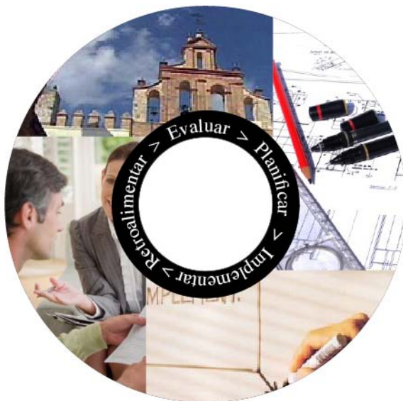
Figura 1. Proceso de Investigación-Acción adaptado a caso de estudio