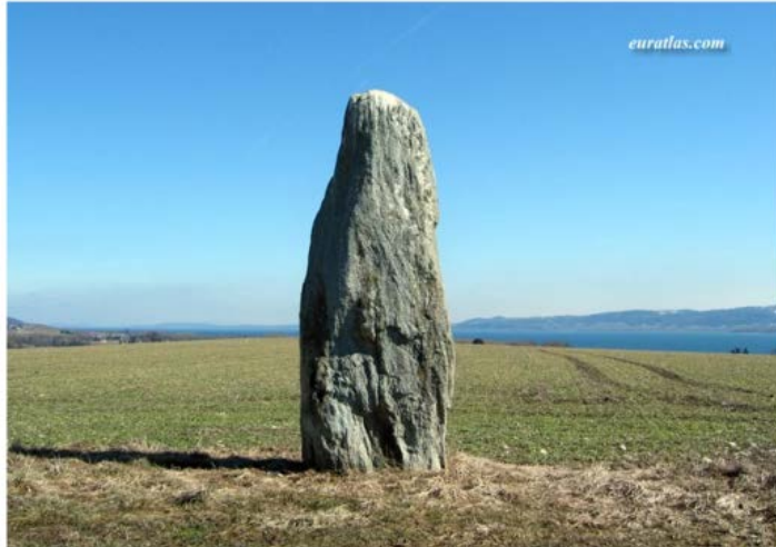
Ja sòc aquí!

Podemos, pues, concluir que las primeras formas arquitectónicas son negaciones de ese espacio. Y no solamente en la forma de refugio. Una de las características de la pura extensión es que no tiene centro. Los así llamados ejes de coordenadas, no constituyen su forma original, sino el