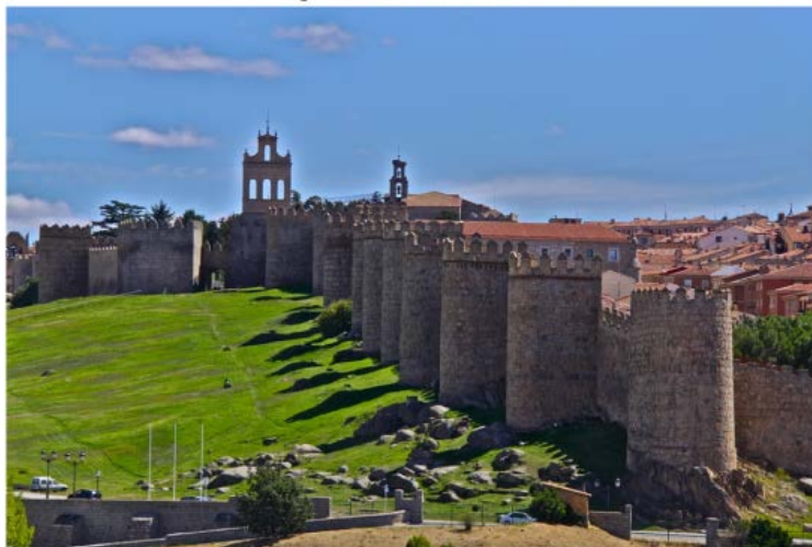
Aquí no entran los malos

De nuevo el espacio abierto es amenaza antes que lujo. Y el hombre tiene que encerrarse junto a otros hombres amantes de la paz, para defender en común lo suyo. De este modo se distingue el ordo civitatis , en el que impera la ley y la justicia puertas adentro de