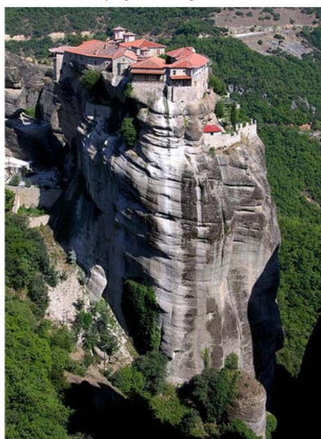
¡Aquí no nos pillan!

Habíamos dicho que la arquitectura es lo que hace del espacio un lujo. Pero queda mucho para llegar ahí, porque la forma primera de la arquitectura es efectivamente marsupial, y así es en cierta forma la negación de lo que ese espacio tiene de foránea extensión. Probablemente la