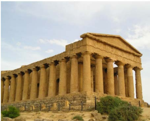
¿A que impone?

primer paso reflexivo hacia su conceptualización; de forma que establecemos, fuera del espacio, un centro respecto del cual medimos la inmensidad. Ese es, pienso, el sentido originario del menhir: un punto absoluto , lo que quiere decir, separado, que de alguna forma representa la inserción del sujeto, como lo que está en sí, en medio de lo que está fuera de sí. El menhir, y su sofisticado desarrollo que es el obelisco, son hitos, que miden el espacio desde lo que no es espacial. Es un «aquí estoy yo», en medio de todo esto. Un desafío al espacio desde fuera de él.