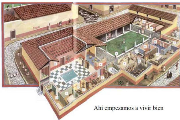
Ahí empezamos a vivir bien

De momento, esta estructura es reflexiva sólo en la medida en que la vivienda y la cosecha, que es «recolección», generan interioridad. También en el sentido de algo absoluto y separado de todo, y hasta cierto punto también sagrado. En la vivienda se constituye en su absoluta particularidad («Cada uno en su casa y Dios en la de todos», decimos) la célula elemental de supervivencia y procreación, también de producción económica y de inserción civil. Es, tanto en el mundo romano como en el anglosajón de la common law , el albergue de la familia, y como tal algo definido por la privacy , como lo radicalmente exento del espacio público. En efecto, aquí «absoluto» significa de nuevo lo separado, de modo que la esencia de la vivienda es el sentido excluyente: nadie puede entrar que no sea insistentemente invitado a ello. Hasta el punto de que en el antiguo derecho romano el pater familias era, de puertas adentro, señor de horca y cuchillo; y en la common law , a partir de la Carta Magna, ya en el siglo XII, se reconoce como derecho elemental, junto al habeas corpus , la «inviolabilidad del domicilio»: My home is my castle .