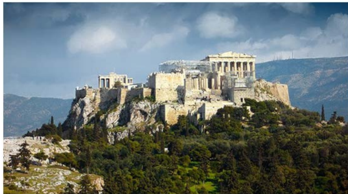
Sobrevivirán a la crisis

Pero efectivamente no podemos olvidar que, en su aparente solidez, son de barro, tan precarios como la existencia a la que pretenden dar albergue. Y entonces sí me atrevo a una última palabra: la arquitectura, y con ella el afán constructivo de la historia humana, no puede olvidar de donde vienen, sobre qué cimiento se asientan, que no es otro que la radical finitud. Construimos siempre desde la indigencia, que nunca podemos superar del todo. Y por eso todo edificio está destinado a derrumbarse, al menos si no hay en su base algo que redima lo que de otra forma no puede ser sino sacrílego. Quizás por eso, lo único que queda en pie de aquellos que inventaron la arquitectura, que en definitiva sigue siendo el paradigma de toda construcción y proyecto, son sus templos. Y que quizás son estos los que a la postre hacen la tierra habitable.