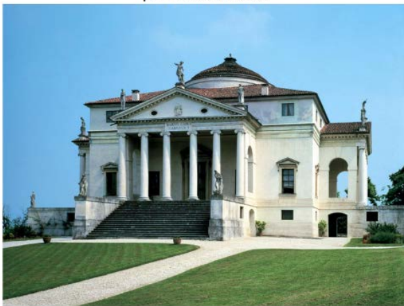
¡Me llamo Palladio!

Está bien, pero este organicismo requiere matices. Porque al habitar, el hombre no busca un nicho ecológico por confortable que parezca. Viviendo en la Casa de la cascada , no un fin de semana sino de modo habitual, yo me sentiría como un lujoso hombre de los bosques, vulgo bosquimano. Y es que la construcción, partiendo de la naturaleza, usando elementos naturales, trasciende esa inmediatez natural