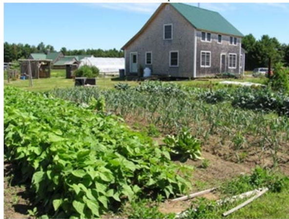
El ideal autárquico

Tras la vivienda viene... la parcela. Que tanta gente esté deseando que llegue el fin de semana para irse al pueblo y ver cómo crecen los tomates y si tienen pienso las gallinas, no es un capricho de la sociedad hiper-urbana, sino, otra vez, un instinto básico del hombre primitivo que genéticamente somos, a quien en el fondo, repito, de su constitucional indigencia, de ser radicalmente un expósito, no le termina de parecer evidente que siempre vaya a haber huevos en el supermercado. De ahí que «labrar» sea en cierta forma la continuación semántica del verbo «construir». De este modo, «habitar» se hace una actividad que se extiende del hogar al corral, de ahí al huerto y al campo adyacente, hasta que hagamos del espacio, no sólo lo que nos alberga, sino aquello que mediante el trabajo produce los medios de nuestra subsistencia.