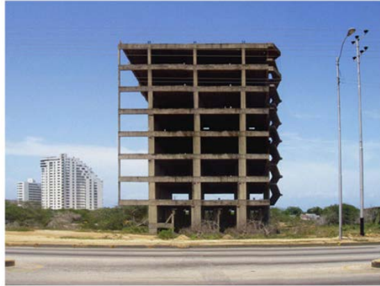
Penitencia inmobiliaria, con pecado al fondo

También es trágica la historia de Prometeo, que se apiadó de los hombres, perdidos en medio de la naturaleza, y robó para ellos el fuego y les enseñó el arte de construir ciudades, despertando con ello la alarma de los dioses. En la misma línea, cualquier americano de las profundas provincias del Midwest te dirá que no confundas las cosas, que la verdadera esencia del país está fuera de Chicago y Nueva York: ciudades impías, que han intentado dejar pequeño a Dios. Lo mismo que los ecologistas, que exigen la renuncia a una actividad constructiva que en su infinita proyección resulta —dicen— insostenible; y buscan para ello la verdad en el Tibet. Y así, no son pocos tampoco los que ahora entre nosotros entienden la crisis que sufrimos como castigo a nuestra impiedad promotora y especulativa, a los pecados del «ladrillo». Hay quien dice que históricamente las grandes construcciones, en las que el hombre creía tener el cielo al alcance de la mano, fueron siempre heraldos de las grandes crisis financieras. El Empire State se terminó en 1929, y la consiguiente crisis duró hasta el 42. Es un extraño presagio que parece cumple ahora para nosotros, con un pequeño retraso, la torre Pelli.