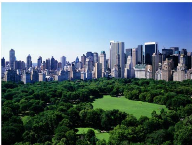
No sabemos lo que queremos

Que sobre las praderas se levanten los rascacielos no es una extravagancia neoyorkina a la que ya nos tiene acostumbrados el cine. Es un símbolo de esa cultura nuestra, en la que, lo que actualmente entendemos por naturaleza, precisamente como ideal confortable, no es sino la proyección al infinito de