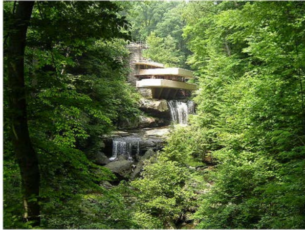
¿Dónde empieza qué cosa?

Por ello, más allá incluso del suelo que se puede hollar, de la tierra que inmediatamente se puede trabajar, la proyección se dirige a lo infinito, de la montaña al valle, y al revés; y de la costa al mar: construir es asomarse a la inmensidad del mundo. Si queremos comprender lo que es el valor inmobiliario, el arquitecto tiene que entender que su obra no termina en sí misma; que el absoluto que refleja, y en lo que consiste su verdadero arte, procede de lo infinito sobre lo que se proyecta. Allí donde es posible, el edificio tiene una esencial relación con la luz, y requiere vistas, desde donde ver más que ser visto.