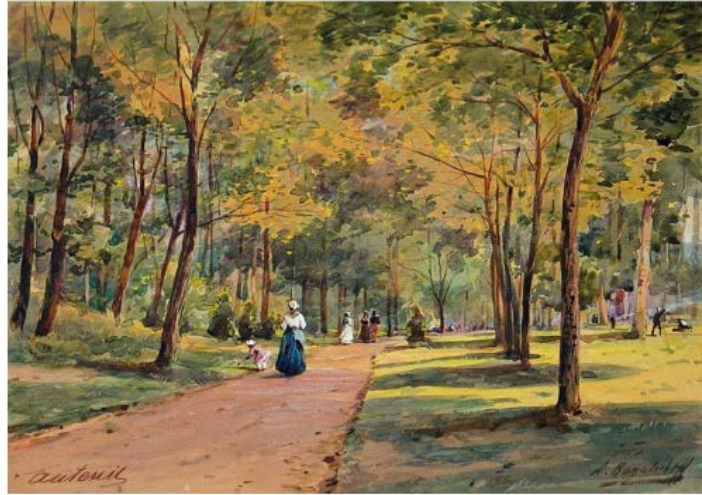
Bois de Boulogne: antes esto, ¡daba miedo!

Pero ahora el proceso del urbanismo es el mismo que hemos visto en la vivienda familiar. Una vez garantizada la supervivencia de sus habitantes, cuando la modernidad, a partir sobre todo del siglo XVIII, impone condiciones generales de seguridad, la ciudad pierde el miedo y se proyecta generando a su