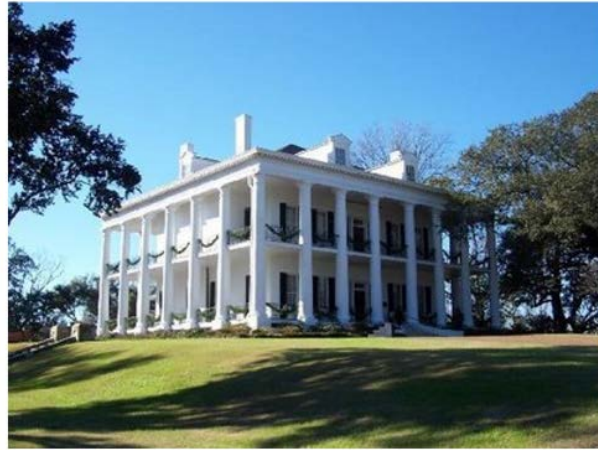
Yo también impongo

una raíz cuasi blasfema, porque sitúa al habitante en el lugar del dios. Por ello, del porche rancharo, a la columnata de las plantaciones del sur, el templo vuelve a hacerse paradigma. De este modo, Palladio merece un respeto, que los teóricos actuales de la arquitectura le niegan. Y pierden, pienso yo, algo esencial con ello.