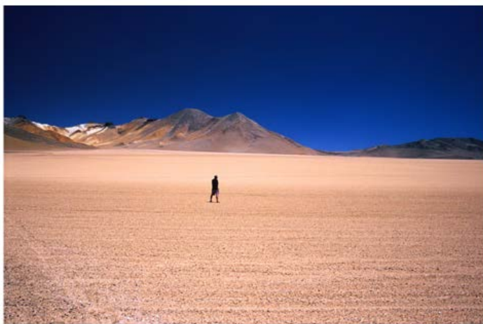
¿Vendrán a recogerme?

De hecho, la vida, que es lo concebido , cenceptus , se abre al exterior, ve la luz, en la forma de shock. En último término el espacio exterior es amenaza y al final su victoria es la muerte, la vuelta al polvo de donde todo lo vivo intenta redimirse. Podríamos hablar de algo así como la