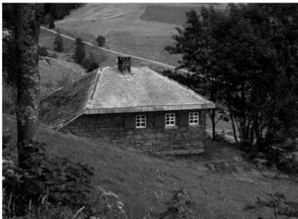
Hütte de Heidegger en Todtauberg No se la compro, por lo que dice que vale

sencillamente reaccionaria. Es reflejo de ese provincianismo á la Petain (que no nazismo, que como ideología postromántica tiene instintos planetarios) que ciertamente representa la filosofía del segundo Heidegger.