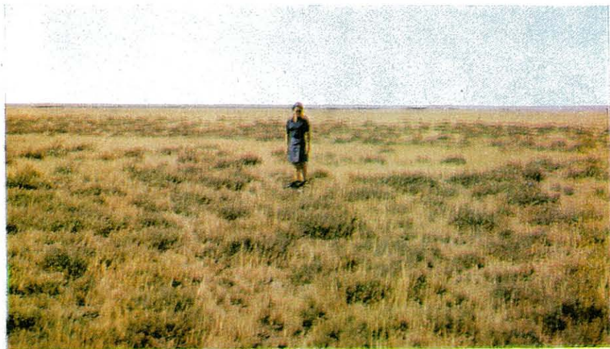
Fotografía núm. 1.—Zonas de estudio. En primer plano aparece la zona núm. 1 y al fondo la núm. 2. Junio 1971.

incrementar así el porcentaje correspondiente al ión bicarbonato, cuyo nivel se mantiene prácticamente constante a lo largo de los primeros 100 cm. de perfil, elevándose luego moderadamente. Sin embargo, el denso tapiz vegetal de la zona número 2 y la existencia de una aceptable estructura superficial en el substrato, son factores que pueden favorecer una mayor solubilización de su importante reserva de carbonato cálcico, lo cual podría explicar también que el porcentaje de iones bicarbonato no sea excesivamente alterado superficialmente cuando se produce el lavado de sales efectuado por el agua de lluvia.