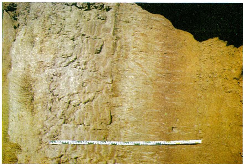
Fotografía núm. 2.—Perfil núm. 1. Se aprecia claramente la existencia de un estrato aluvial (40-50 cm. de espesor) sobre un antiguo suelo de terraza. Junio 1971.