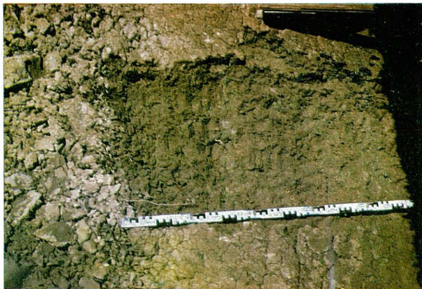
Fotografía núm. 3.—Perfil núm. 2. Aporte aluvial profundo. Marzo 1971.