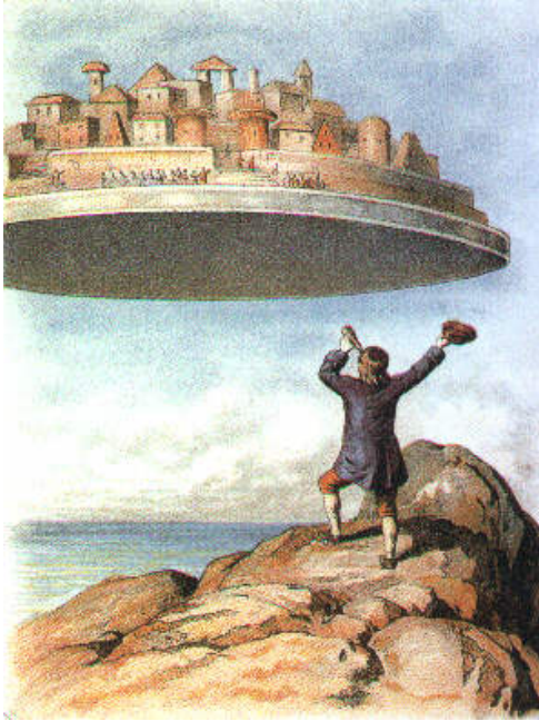
Fig. 1. Jonatan Switf, Gullivers Reisen (Los viajes de Gulliver) de hacia 1910. http://www.geocities.ws/pensamentobr/mapashtml.html (CC BY-NC-ND 2.5)

ta” que era conducida por un grupo de inventores lunáticos con la ayuda de una rueda del tiempo magnética y que acabó en parodia de la “Royal Society”, en su obra Gullivers Reisen (Los viajes de Gulliver) de hacia 1910 (fig. 1).