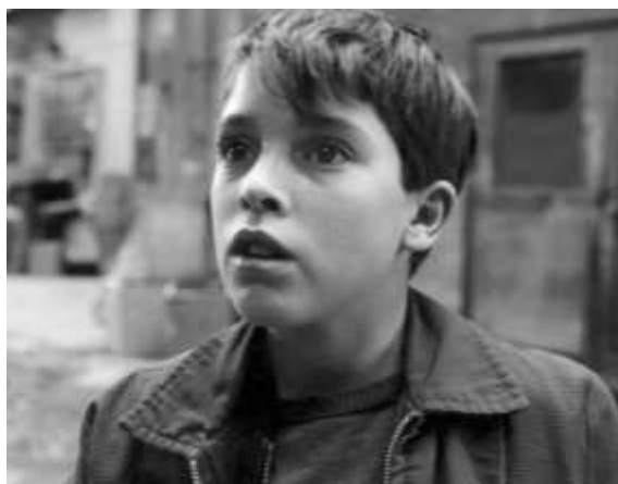
Léolo (Jean-Claude Lauzon, 1992)