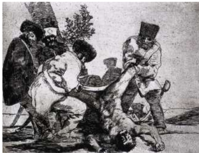
Goya, ¿Qué hai que hacer más? ( Los desastres de la guerra , n. 33) (1814)

No es necesario aducir más ejemplos. La historia del arte pictórico, en este caso, está llena de expresiones artísticas de lo horrible (en un sentido, además, genuinamente violento y “sangriento” ) que no producen horror desde el punto de vista psíquico. Ya o aún estamos y no estamos allí, junto a lo horrible mismo: cerca y, sin embargo, muy lejos . La imagen ha operado el milagro. Estamos mucho más lejos, incluso, de lo que el sabio de Lucrecio se encuentra del naufragio que contempla, pues la imagen ya no pertenece a “lo real”... ni siquiera –por supuesto- cuando lo representa. Es por ello por lo que no podría quedar