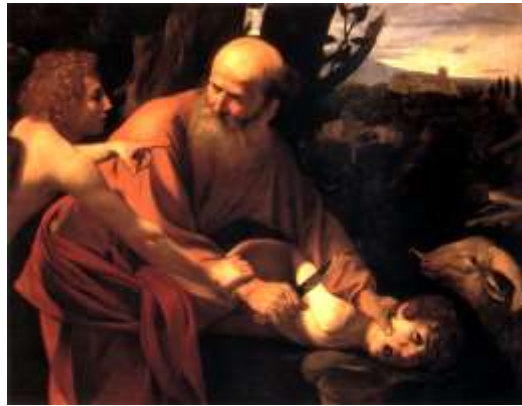
Caravaggio, Sacrificio de Isaac (1603)

en algunas de las imágenes que la pintura consagró, en numerosas ocasiones, al episodio bíblico del sacrificio de Isaac, o en alguno de los grabados de Los desastres de la guerra , de Goya. La distancia del sabio Lucreciano se ha convertido en Imagen , y más concretamente, en el horizonte de la expresión artística , con la singularidad de que el arte pugna por hacer no atractiva , sino atrayente-y-meditativa a la imagen.