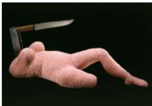
L. Bourgeois, de la serie Femme-couteau (2002)