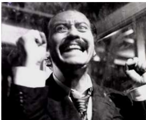
Fotograma de La cabina (A. Mercero, 1972)

La demora meditativa que la expresión artística de lo horrible hace posible puede contribuir al aprendizaje en torno a lo horrible como tal, más allá del horror , si bien, ciertamente -¡cómo despreciar esta circunstancia!-, en la medida en que una expresión artística puede brindarnos acceso a ello, inconmensurable con la dureza de lo horrible mismo acontecido en medio de lo real.