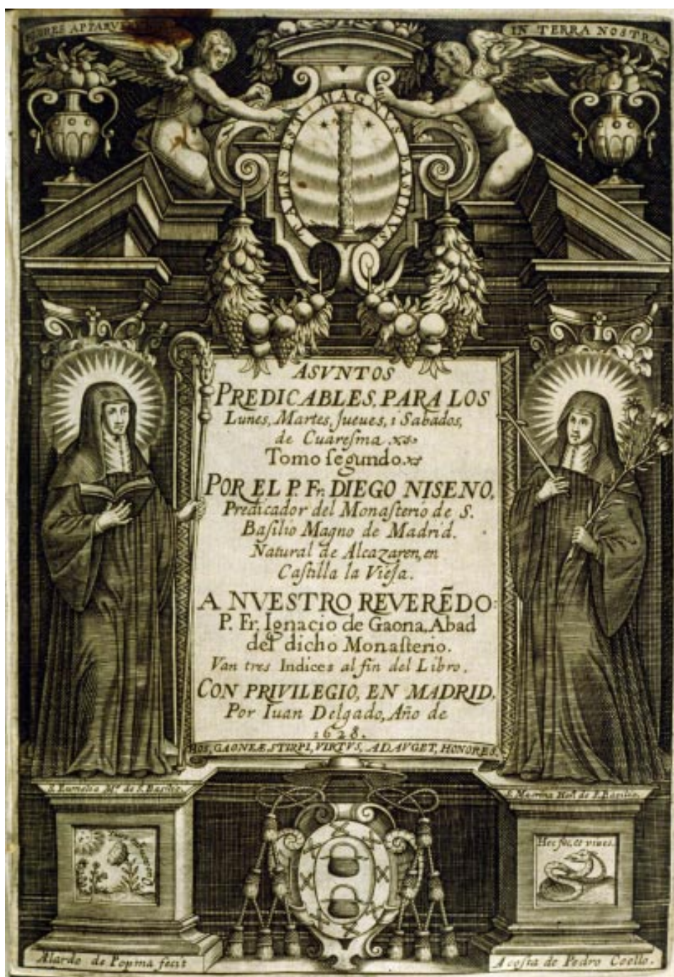
5. Diego Niseno: Asuntos predicables para los lunes, martes, jueves y sábados de quaresma , Madrid, Juan Delgado, 1628 © Biblioteca Nacional de España, 2/45753