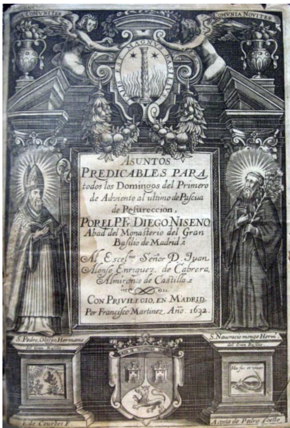
8. Diego Niseno: Asuntos predicables para todos los domingos del primero de Adviento al último de Pascua de Resurrección , Madrid, Francisco Martínez, 1632. Biblioteca Universitaria de Sevilla 59/52