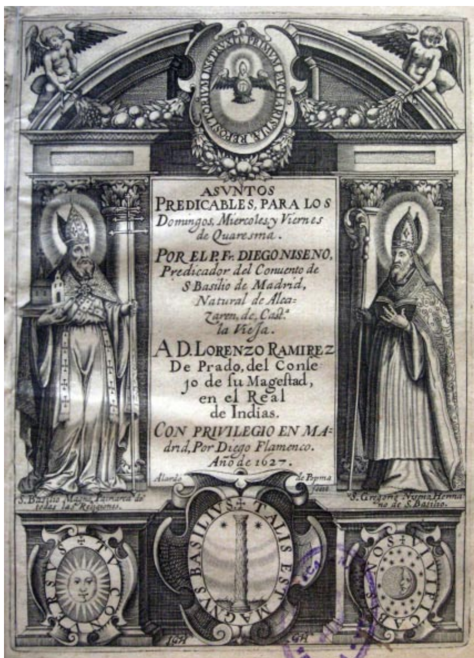
2. Diego Niseno: Asuntos predicables para los domingos, miércoles y viernes de quaresma , Madrid, Diego Flamenco, 1627. Biblioteca Universitaria de Sevilla 203/43.