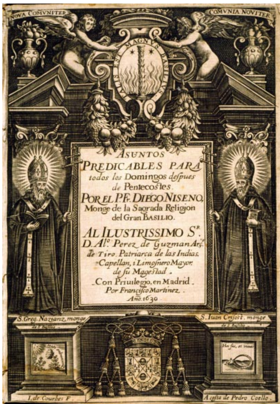
7. Diego Niseno: Asuntos predicables para todos los domingos después de Pentecostés , Madrid, Francisco Martínez, 1630 © Biblioteca Nacional de España, 2/45966.