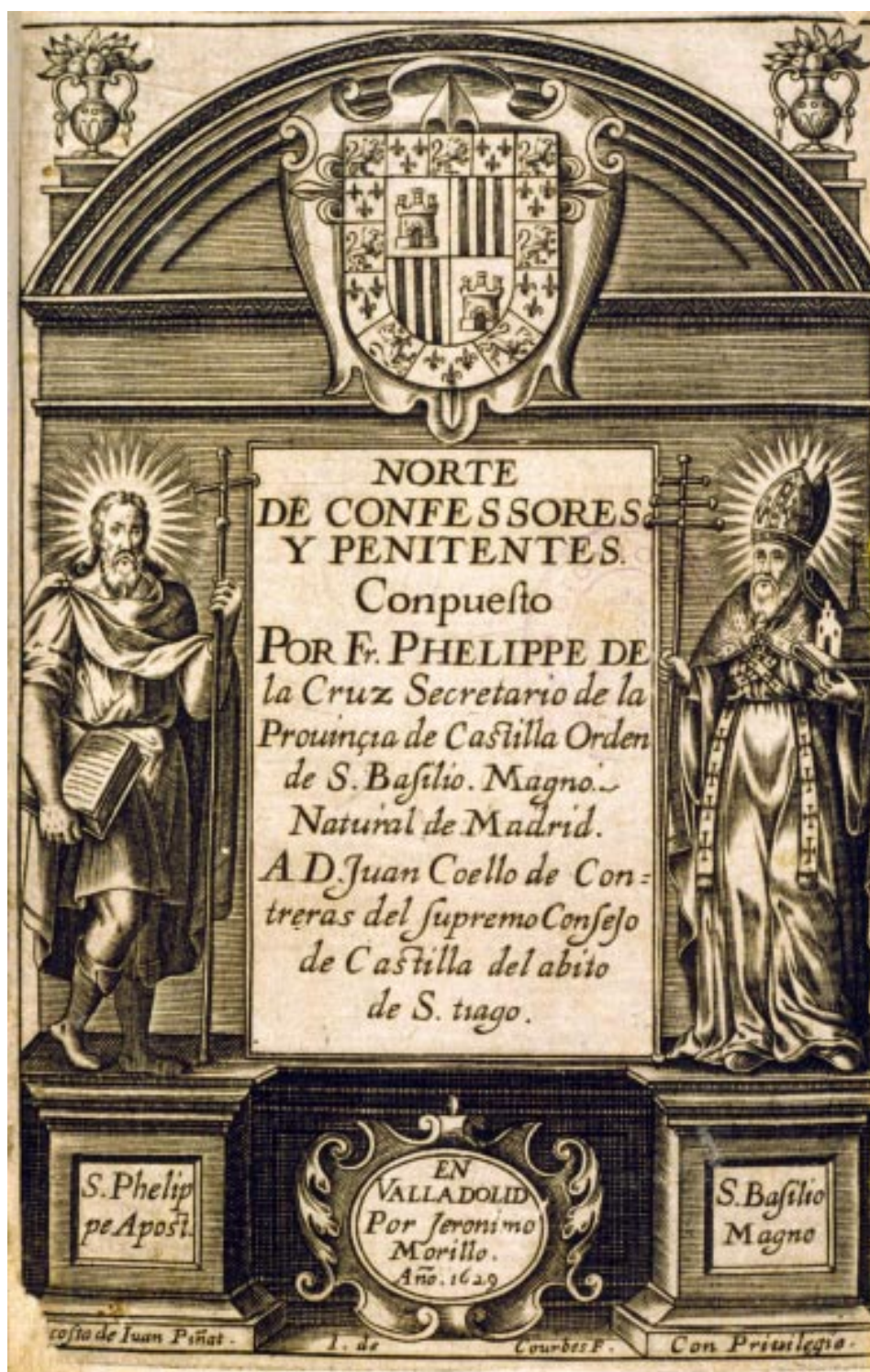
10. Felipe de la Cruz Vasconcellos: Norte de confesores y penitentes , Valladolid, Jerónimo Morillo, 1629 © Biblioteca Nacional de España, 3/57546