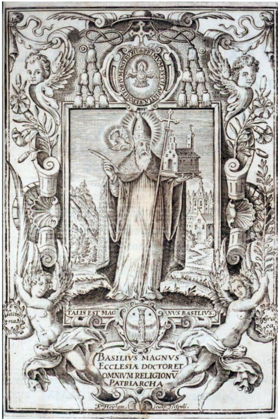
1. Cardenal Bessarion: Compendio de la Regla de nuestro P. S. Basilio Magno... , Sevilla, Clemente Hidalgo, 1615 © Biblioteca Nacional de España, 2/42355