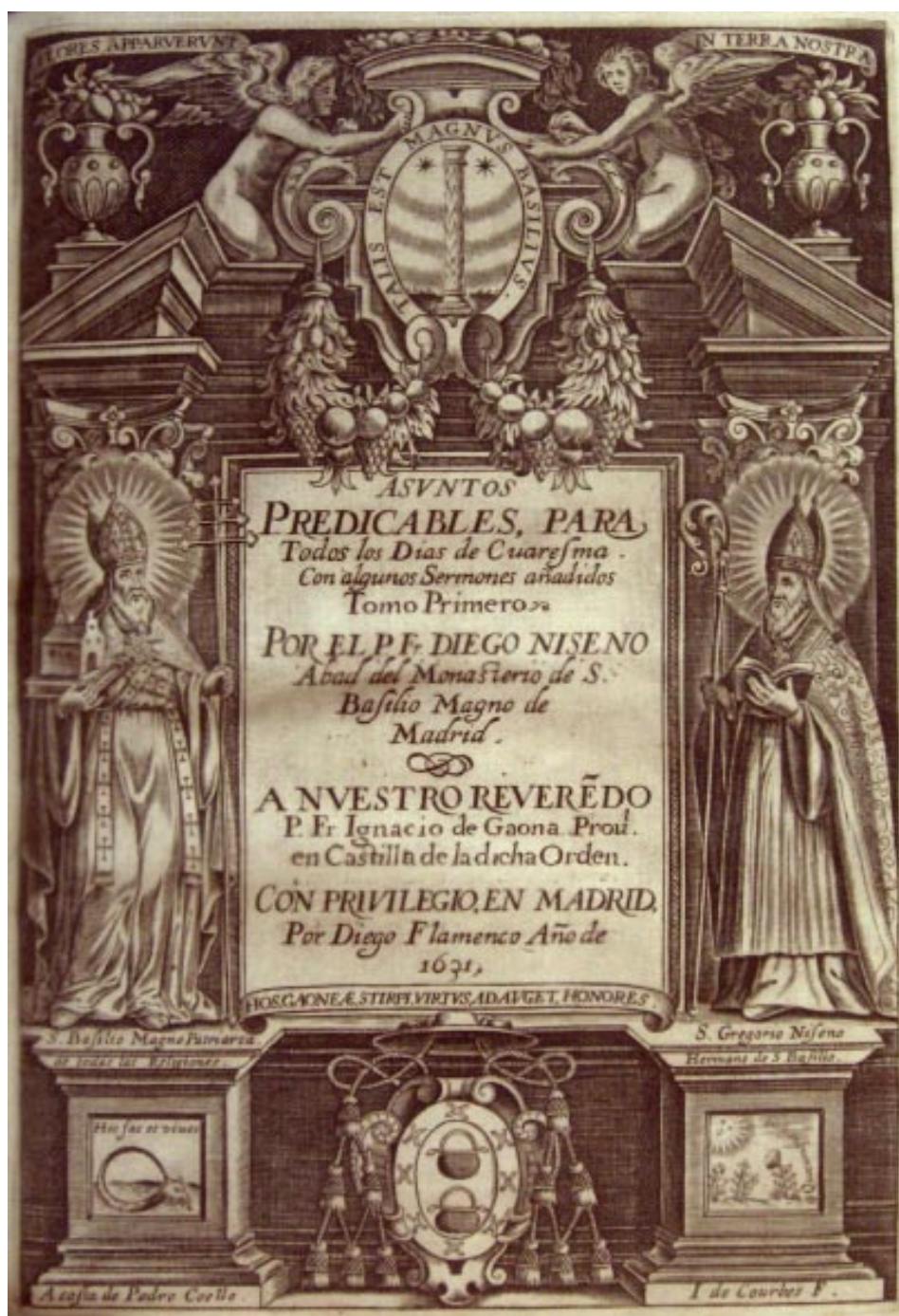
6. Diego Niseno: Asuntos predicables para todos los días de Cuaresma: con algunos sermones añadidos: tomo primero , Madrid, Diego Flamenco, 1631. Biblioteca Universitaria de Sevilla 59/53