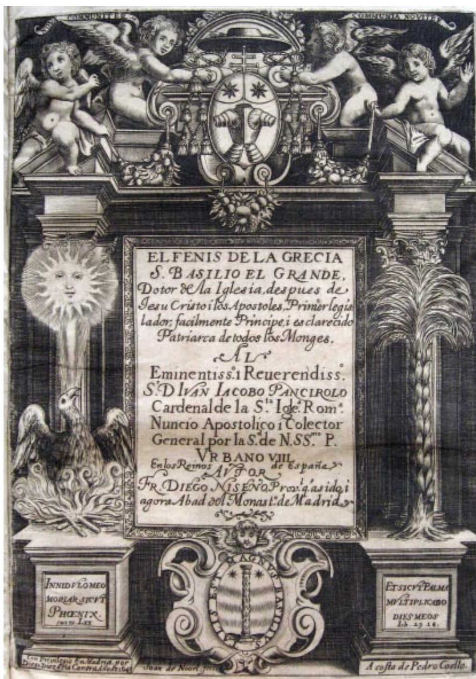
9. Diego Niseno: El fenis de la Grecia S. Basilio el Grande , Madrid, Diego Díaz de la Carrera, 1643. Biblioteca Universitaria de Sevilla A 129/34