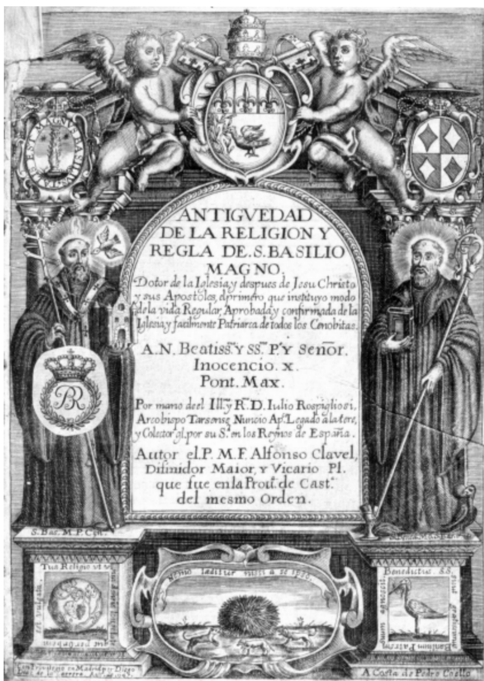
13. Alfonso Clavel: Antigüedad de la Religión y Regla de San Basilio Magno... , Madrid, Diego de la Carrera, 1645 © Biblioteca Nacional de España, 3/9187