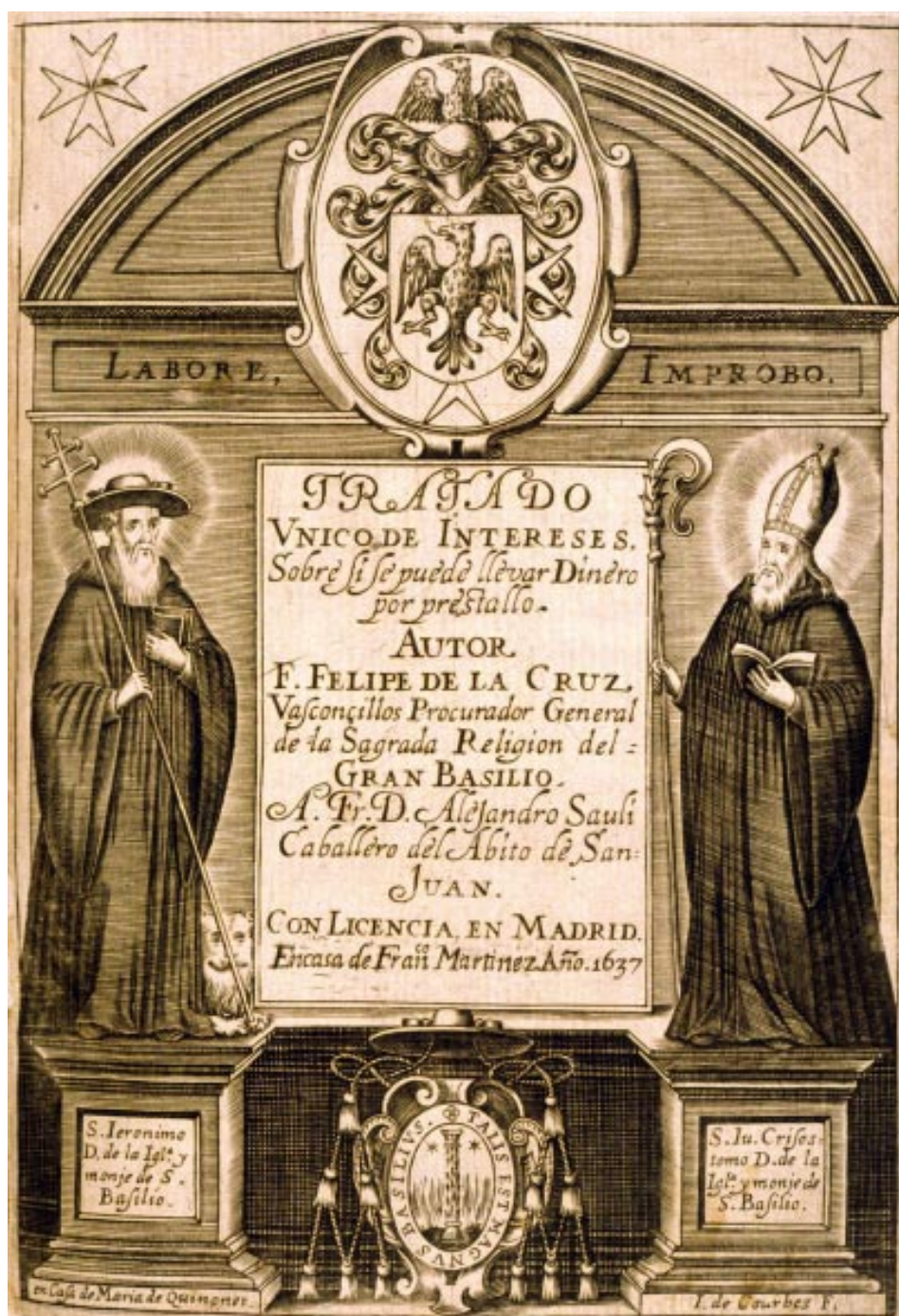
12. Felipe de la Cruz Vasconçillos: Tratado Vnico de intereses sobre si se puede llevar dinero por prestallo , Madrid, Francisco Martinez, 1637 © Biblioteca Nacional de España, 3/19453.