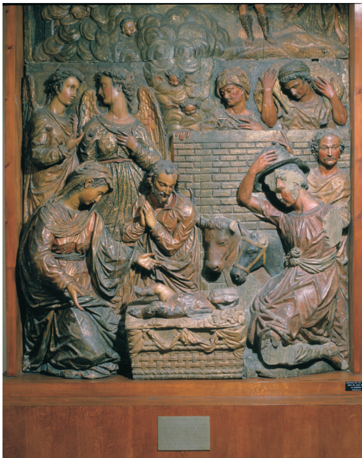
Fig. 2. Relieve de la Adoración de los Pastores del retablo mayor de la parroquia de Nuestra Señora de Consolación de Cazalla de la Sierra. Museu Frederic Marès. Barcelona.

nico era deudor de las composiciones de Oviedo 12 . Por lo tanto, de esta labor conjunta tan sólo quedan los relieves salvados del desgraciado retablo de Cazalla (fig. 1), en los cuales ya se había intuido la presencia de Montañés. De hecho, el de la Adoración de los Pastores (fig. 2), que hoy se encuentra en el Museo Marés de Barcelona, se había atribuido al maestro alcalaíno antes de su identificación como perteneciente al altar de Cazalla y su consiguiente adjudicación al catálogo de obras de Oviedo y de la Bandera 13 .