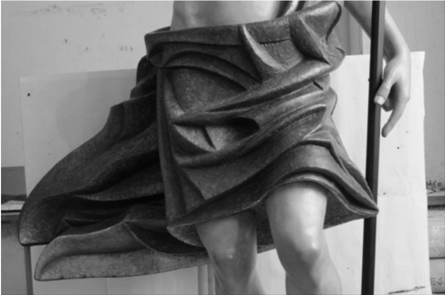
Fig. 11. Cristo Resucitado (Detalle)