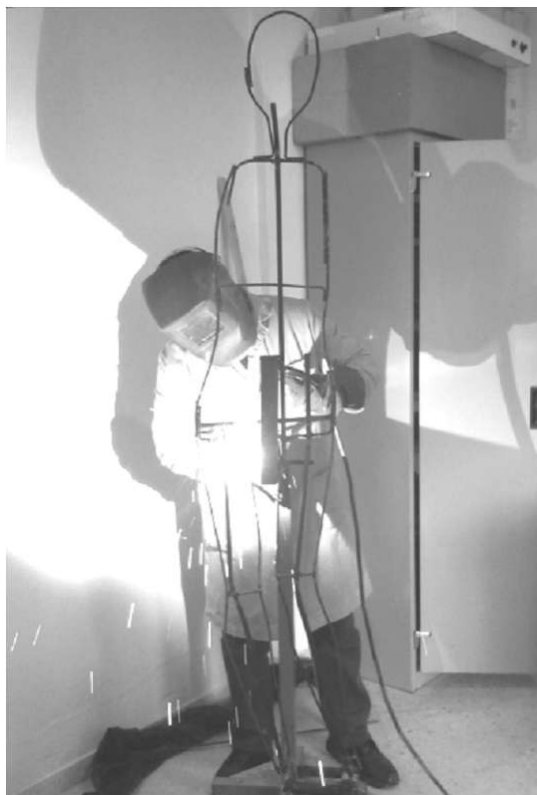
Fig. 6. Soldando la estructura metálica

El procedimiento de trabajo se ha desarrollado siguiendo los pasos tradicionales empleados en la configuración de una escultura de bulto redondo. En primer lugar, la configuración de la estructura metálica siguiendo las directrices proporcionales y compositivas planteadas en el boceto previo realizado a pequeña escala. (Figs. 6-9).