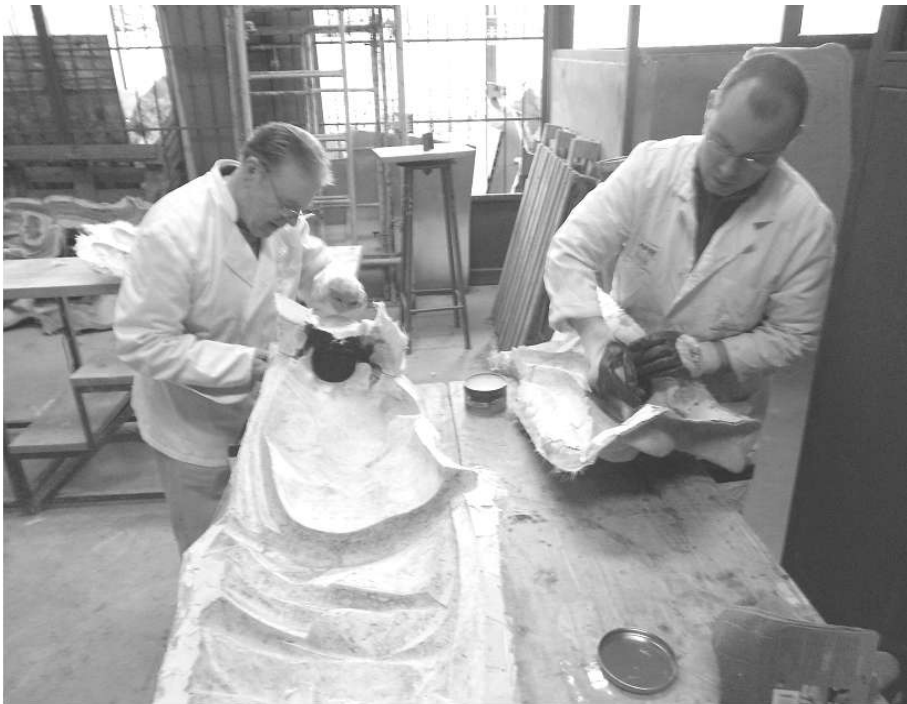
Fig. 7. Tratamiento del molde semi-flexible para positivar en resina de poliéster

Atendiendo a las características de la imagen y a su tamaño, hubo de emplearse un material de alta resistencia y poco peso, siendo la resina de poliéster el adecuado por cumplir plenamente todos los requisitos.