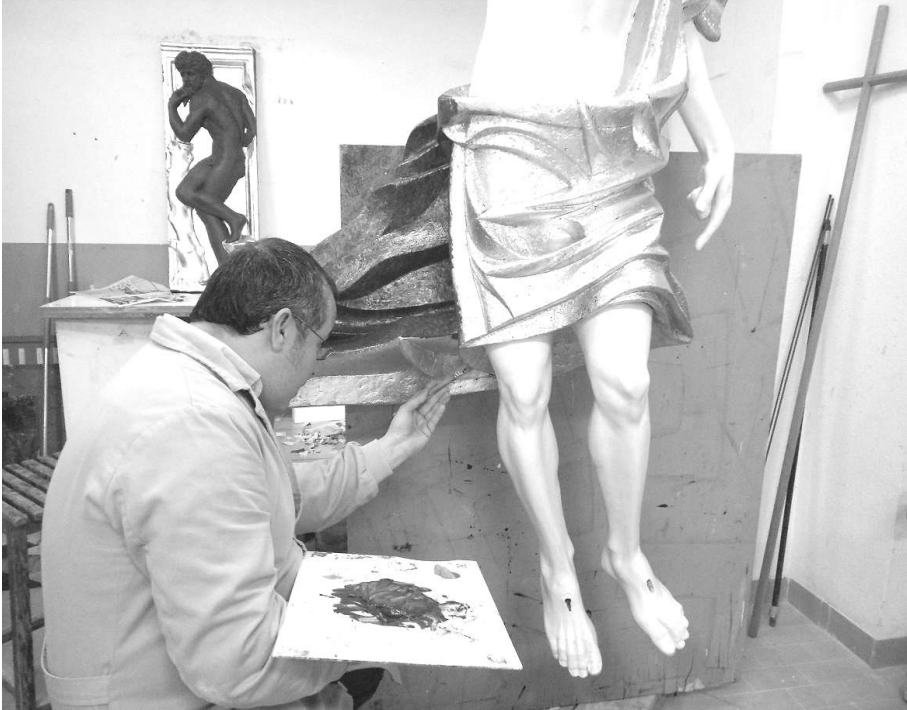
Fig. 9. Realización del estofado con temple al huevo sobre pan de oro

Con la imagen dorada y aplicado el tono base de la encarnadura, se procedió a la aplicación del temple para su estofado sobre la superficie metalizada. El tratamiento de las encarnaduras va enfocado a potenciar el volumen para dar profundidad al relieve superficial y para ello se ha recurrido a tonalidades frías favoreciendo de este modo el efecto de la pátina y el realce de la forma mediante el color. Las zonas más salientes de la anatomía del Resucitado han sido tratadas con tonalidades cálidas, potenciando visualmente las valoraciones que se observan en el estudio del natural con modelo vivo. (Figs. 10 -13).