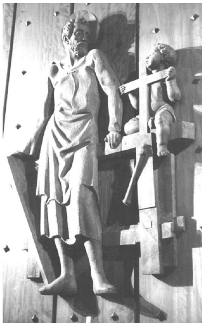
Fig. 3. San José, J. Gamó Capilla de San José (Madrid) 1950