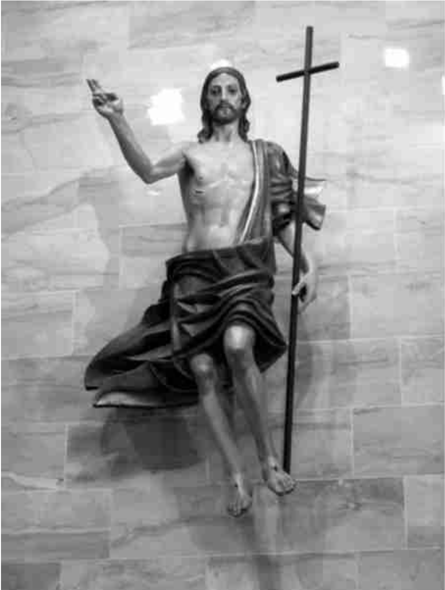
Fig. 13. Cristo Resucitado de Torremolinos (Málaga)