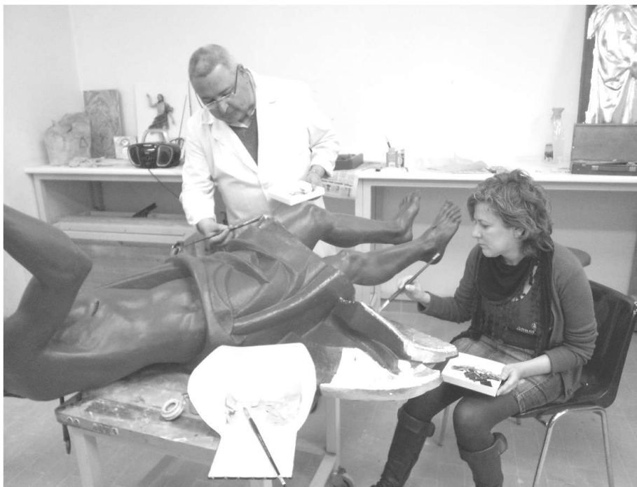
Fig. 8. Proceso de dorado la imagen con pan de oro siguiendo el proceso de dorado denominado a la sisa o dorado mate

La representación de la escultura polícroma concebida de un modo naturalista, pretende enmascarar el material o soporte para potenciar externamente el efecto de naturalidad.