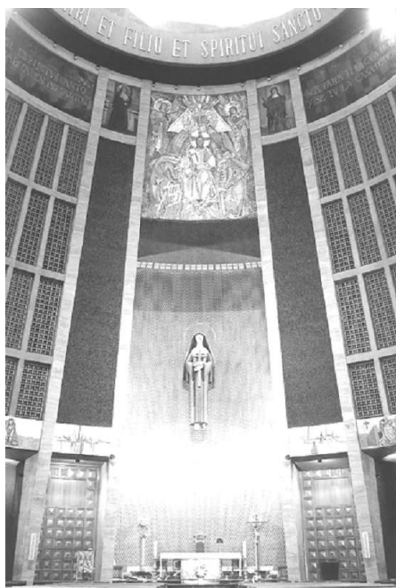
Fig. 4. Antonio Martínez Penella. Retablo de Santa Rita. (Madrid) 1959

Del mismo modo, en el proceso constructivo de las imágenes destinadas al culto aparecen nuevos materiales que por su naturaleza se han desvinculado de su operatividad funcional y se han adaptado a nuevas formas de expresión, en este caso el hormigón o el hierro forjado ejemplifican dicha incorporación con fines artísticos.