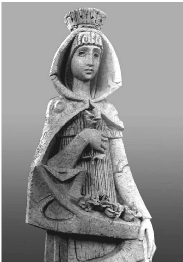
Fig. 5. Santa Isabel de Portugal. Fuentes del Olmo, Manila (Filipinas) 1967

La integración de nuevos materiales supone un enriquecimiento añadido dada su variedad y resultados estéticos. Los recursos y técnicas tradicionales se han adaptado paulatinamente a las nuevas formas expresivas. En consecuencia, los artistas han experimentado un proceso de especialización en el manejo y aprovechamiento de los nuevos medios de creación.