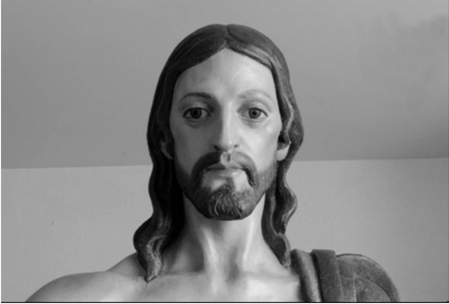
Fig. 10. Cristo Resucitado (Detalle)