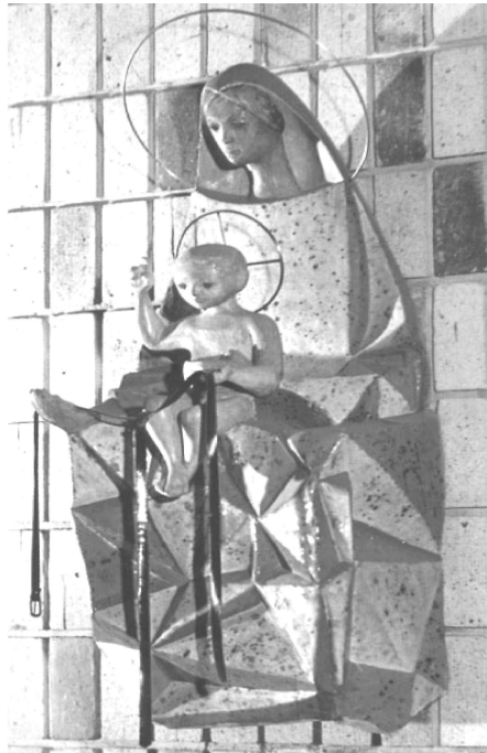
Fig. 1. Virgen con Niño. Obra de José Luis Sánchez. Templo de Santa Rita (Madrid) 1950

Esta evolución a lo largo del tiempo se ha hecho patente en manifestaciones plásticas muy diferentes; especial atención hemos de prestar a las que ocupan la segunda mitad del siglo XX tras la aparición de las vanguardias.