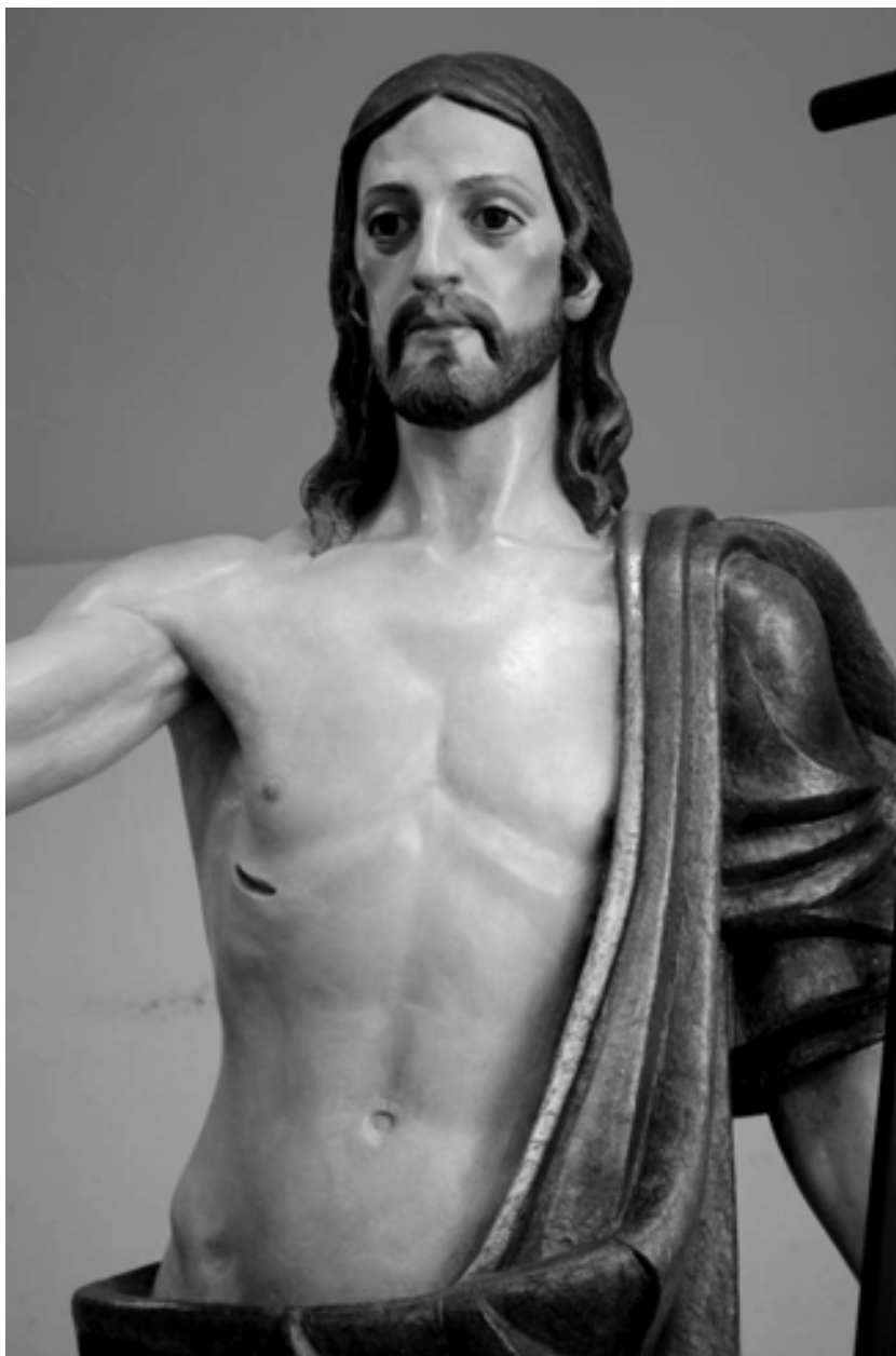
Fig. 12. Cristo Resucitado (Detalle)