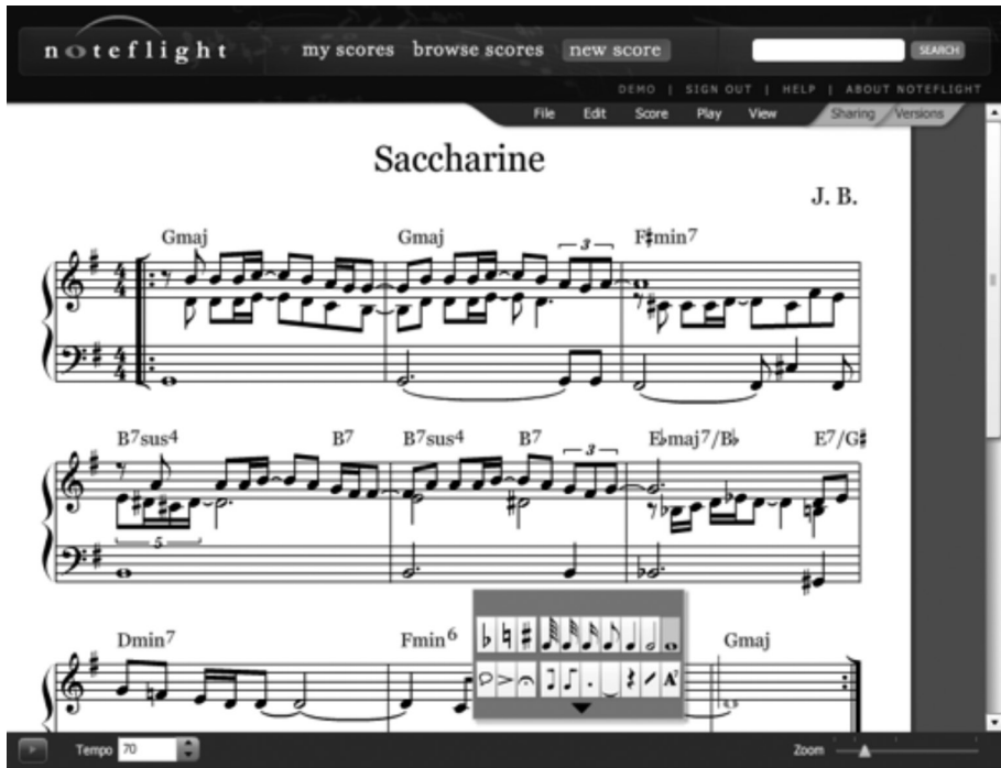
Figura 2. Captura de pantalla del editor Noteflight

También contamos con aplicaciones para móviles o ipad con las que crear y editar partituras como Prelude Composer : < https://play.google.com/store/apps/details?id=gwk.music.PreludeComposer&hl=es >.