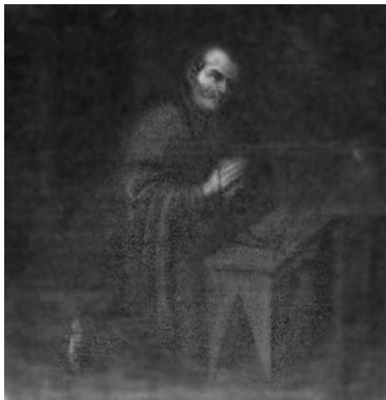
Fig. 4: Obrador de Miguel de Santiago: Fray Francisco Guerrero . (Portería del Convento de San Francisco, Quito, ca. 1670)

los cuatro frailes realizados por el obrador aparecen solos sobre un fondo neutro de color oscuro. Visten el hábito franciscano y ocupan prácticamente toda la superficie del lienzo, lo que les otorga una mayor monumentalidad potenciada por su situación en alto. Esta forma de componer sigue las pautas que el maestro había utilizado en las pinturas de Fray Domingo y Fray Pedro , optando por el formato vertical como el más conveniente, tanto para el lugar en el que se habían pintado, cuanto para el tema representado. El efecto claroscuro de estas pinturas está acentuado por la luz que entra en la portería a través de dos vanos cubiertos con rejas (las puertas), que propician que al primer golpe de vista se destaquen los rostros de los frailes sobre la