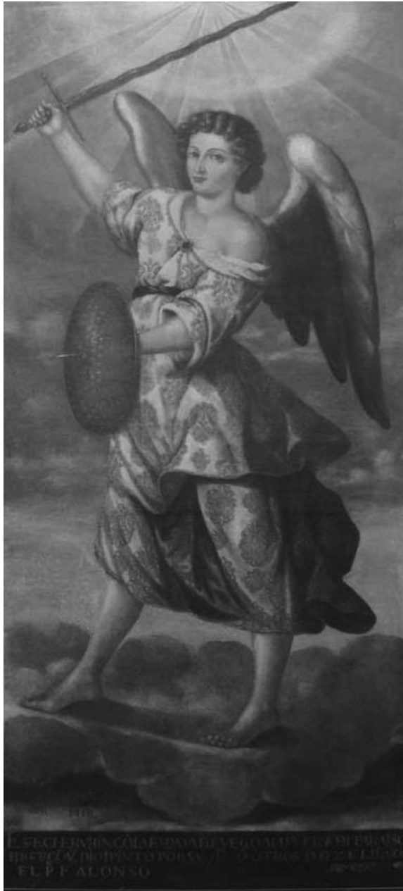
Fig.1:Fray Alonso Vera de la Cruz: Uriel (Convento de San Agustín de Quito, Museo, ca. 1656)*