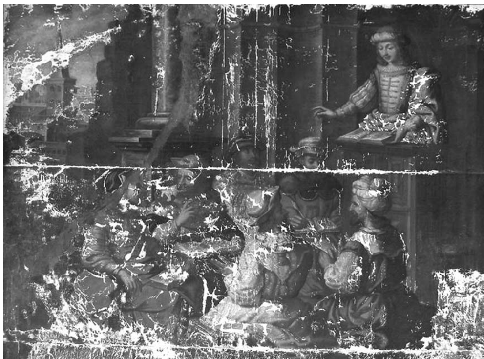
Fig. 2: Bernabé Carreño: San Agustín enseña retórica en Milán (Convento de San Agustín de Quito, galería sur del claustro, 1656)

De Carreño no se había encontrado hasta el presente ninguna documentación. Resulta paradójico que en Quito los pocos cuadros firmados en el siglo XVII pertenecen, salvo excepciones, a pintores cuya presencia documental es inexistente hasta la actualidad, mientras que de otros ampliamente representados en los archivos capitalinos no se ha encontrado aún ningún cuadro firmado. Al menos sabíamos que Carreño colaboró con Miguel de Santiago en las pinturas de San Agustín, por lo que habría sido compañero de obrador de Lobato y Valenzuela, perteneciendo a esa primera generación de discípulos 60 .