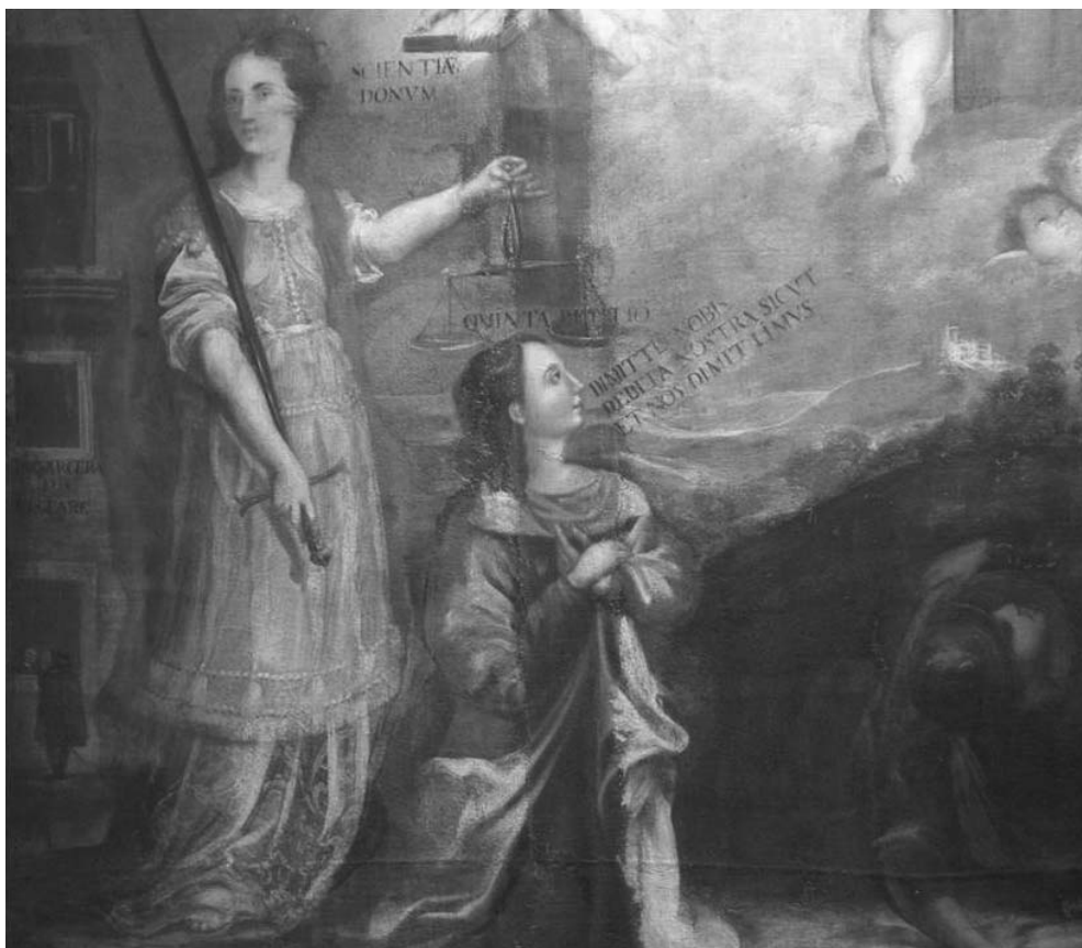
Fig. 6: Detalle de No matarás (perteneciente a la Doctrina cristiana , ca. 1670), en el que se observa la intervención del taller en las figuras de la Justicia y de la Petición del Padrenuestro (Museo del Convento de San Francisco, Quito)