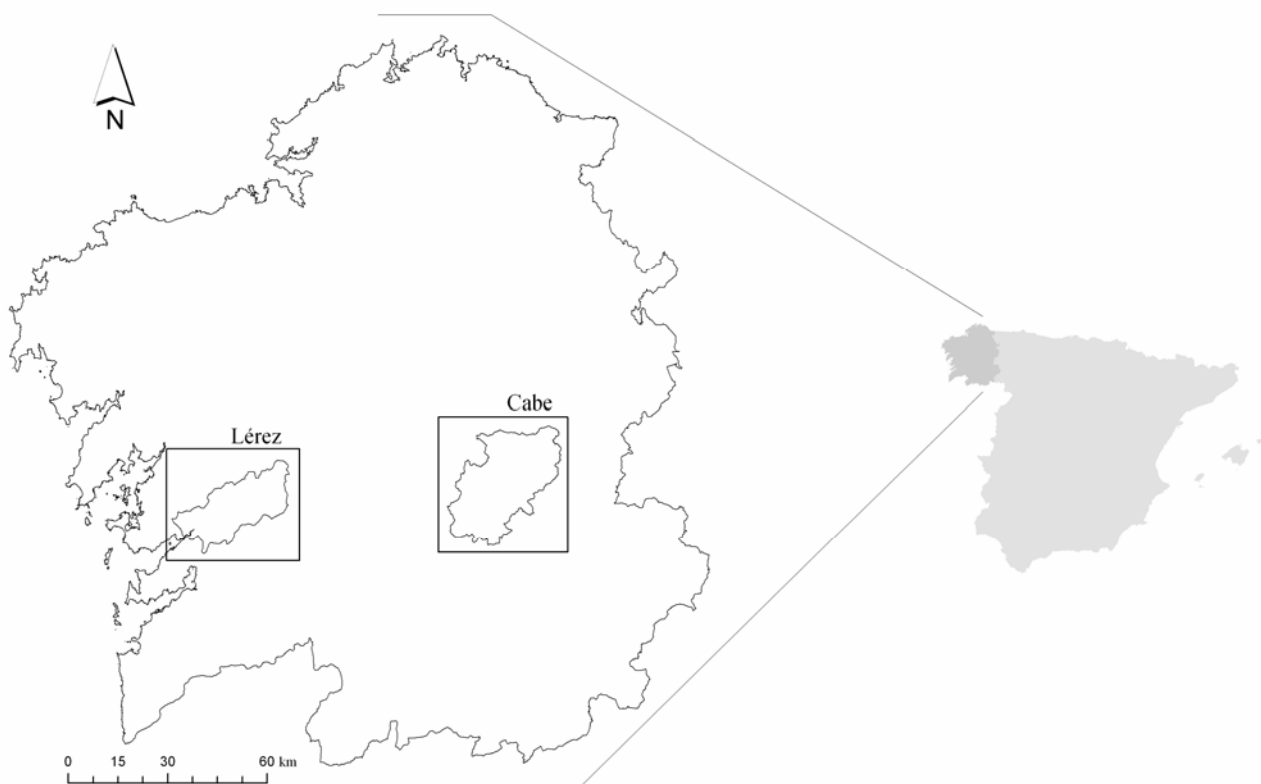
Figura 1. Encuadre territorial de las zonas de estudio. Galicia (España)

El ensayo metodológico llevado a cabo ha sido realizado sobre la cuenca pontevedresa del río Lérez (453 km 2 ) y la lucense del río Cabe de 733 km 2 (Figura 1). No obstante, el lugar de aplicación no deja de ser una mera anécdota en el sentido de que la problemática suscitada con la información del IGN aquí citada (© Instituto Geográfico Nacional de España, 2008) surge en el momento en que el área de estudio se ubica sobre los límites de dos o más MTN25.