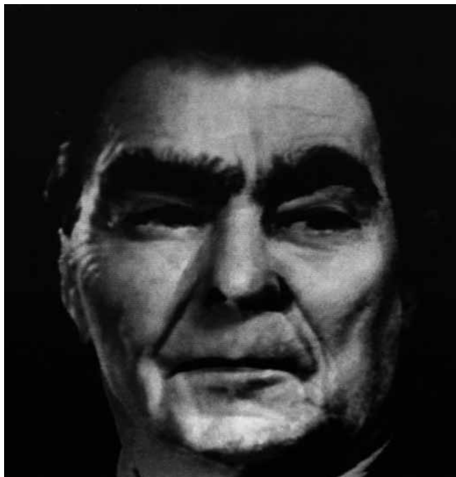
Nancy Burson. Warhead I , 1982.