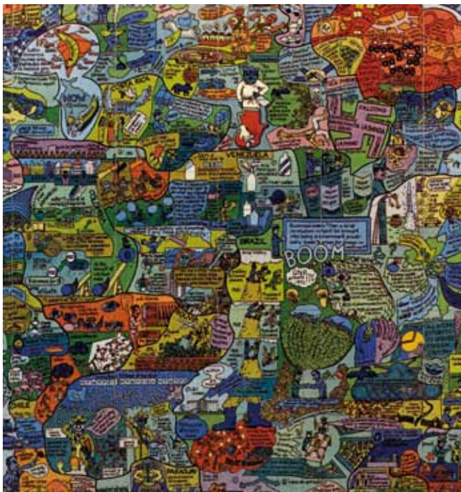
Öyvind Fahlström. Section of a Map-A-Puzzle , 1973. Serigrafía con 40 piezas magnéticas sobre vinilo 51 x 81,5 cm.

La vigencia y actualidad de estos mapas se demuestran en el cada vez más creciente número de exposiciones que recogen este fenómeno. Tan sólo durante el año 2010 se han producido una gran cantidad de ellas. En Londres, en el Centro Rivington Place, durante los meses de junio y julio se pudo visitar la muestra "Whose map is it? New mapping by artists". Continuada de la iniciativa "Creative zapping", celebrada durante el 2007, esta presentaba las obras de artistas reflexionando mediante mapas sobre los más variados temas. El concepto de movilidad quedaba recogido en la obra de Bouchra Khalili Mapping Journey , quien narra, a través de la cartografía, las vicisitudes de tres emigrantes sin papeles viajando por Europa, cuestionando los simples trazados de líneas sobre el mapa como medio de diferenciar las fronteras y los espacios no oficiales que se escapan a estas delimitaciones. Milena Bonilla con su obra Variations on a homogeneous landscape trabaja con visiones de contornos litorales de mapas que, unidos entre sí y perdida la referencia aérea de la vista, funcionan como perfiles de nuevos paisajes propuestos por la artista. Mezcla, de esta forma, cartografía y vistas en una silueta continua. Además de estos participaron con sus mapas artistas como Alexandara Handal, Gayle Chong Kwan, Otobong Nkanga o Esther Polak entre otros.