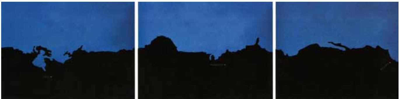
Milena Bonilla. Variations on a homogeneous landscape , 2006. Serie de 27 pósters de 21,5 x 28 cm cada uno. Fuente: CORNER, 2010: 17