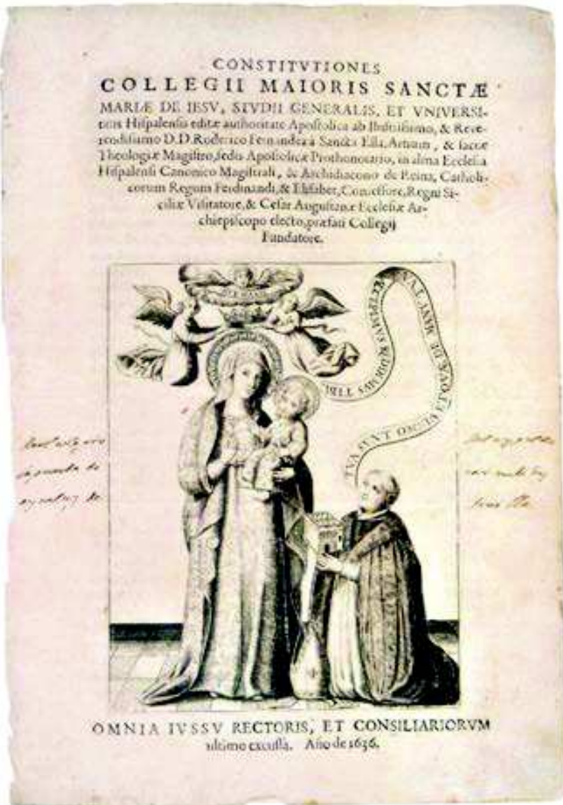
Olivares fue patrono del Colegio de Sta. María de Jesús, matriz de la Universidad de Sevilla.

En este terreno la relación recién adquirida con el Colegio de Santa María de Jesús y con la Universidad es secundaria, pero significaba un ornato simbólico que no debe ser despreciado. Sabemos que el monarca asistió a un acto universitario y que los colegiales y el claustro fueron recibidos por el mismo en una audiencia en los Alcázares. Mayor calado tuvo la celebración de un cabildo municipal, que contó con asistencia del mismo Olivares, en que se discutió y votó la aceptación de la ciudad a la contribución en el impuesto de los millones que estaban tratando las cortes.