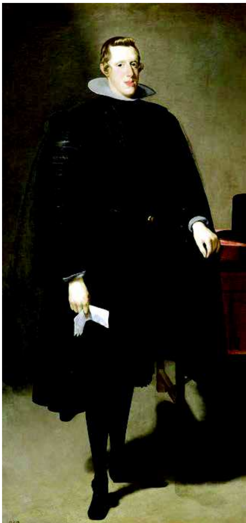
Guiado por Olivares, Felipe IV recorrió Andalucía entre febrero y abril de 1624.

LA VISITA REAL. Como ha puesto de relieve Elliott, con el periplo del rey en febrero-abril de 1624 Olivares se dejaba llevar por “el impulso de orgullo de un patriota andaluz”, pero lo fundamental eran los objetivos políticos que se perseguían. Precisamente, el ejercicio del patronazgo y la definición del clientelismo constituiría el medio imprescindible para la consecución de los mismos.