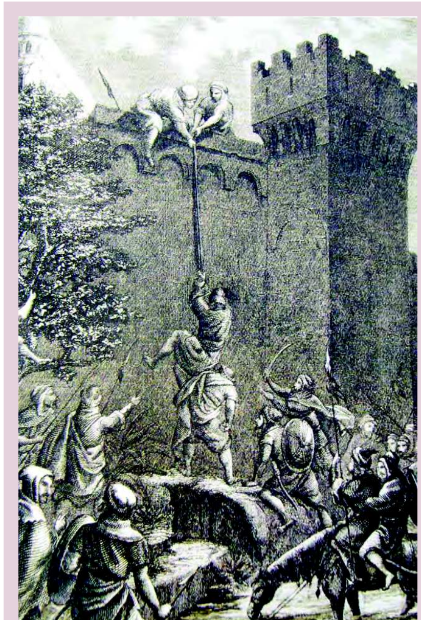
La conquista de Córdoba por Muguiz ar-Rumi, según un grabado del siglo XIX

Textos relevantes entre los que sobresale el Muqtabis de Ibn Hayyán (muerto en 1076),