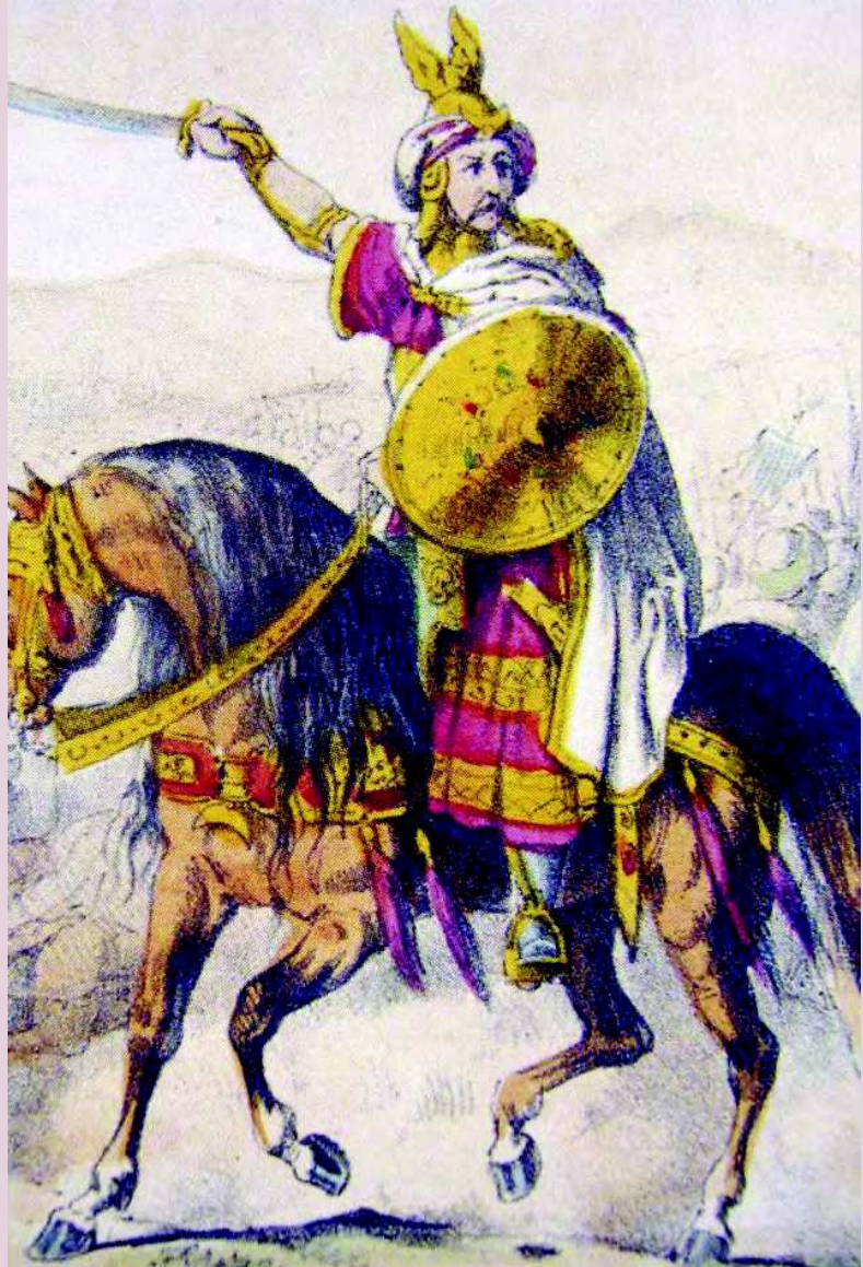
Tariq ibn Ziyad en una xilografía alemana del siglo XIX

cluida la producción historiográfica, la herencia de los exilados por las conquistas castellanas y aragonesas del valle del Guadalquivir y el Levante. Este último