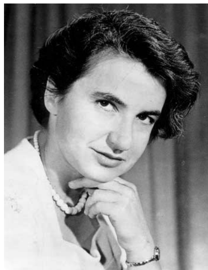
Figura 1. Rosalind Franklin.

descripción misógina que hace de Franklin es mezquina (Sayre, 1997), además de que hablaba de una persona que había muerto en 1958, diez años antes de la primera edición en inglés, y que no podía defenderse (figura 1). Se refiere a ella como “Rosy”, un apodo por el que no era conocida, y la describe como una mujer poco femenina, que no cuidaba demasiado su aspecto, inflexible, rígida, agresiva, altiva, y algo marisabidilla (Martínez-Pulido, 2000).