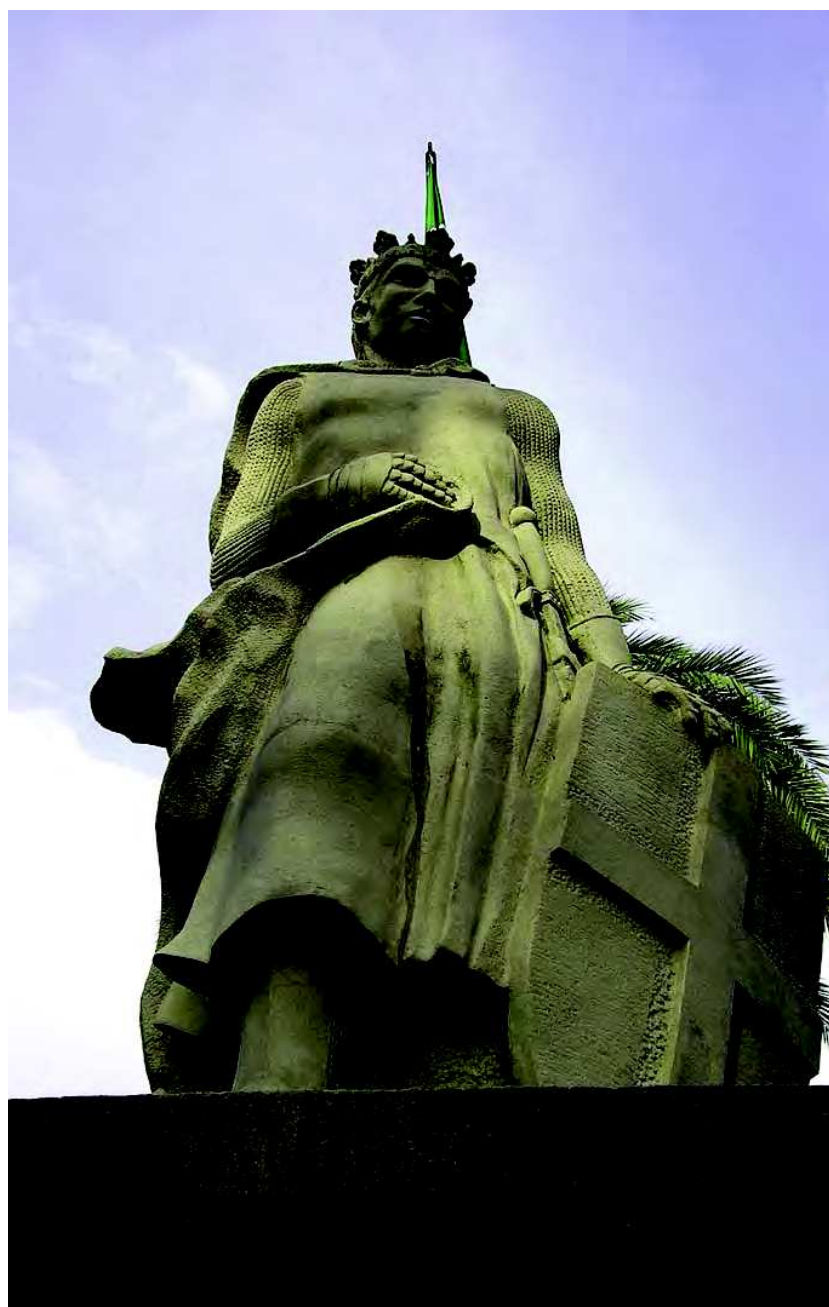
La política de Alfonso XI supuso el fin de la Hermandad General de Andalucía.

Por último, después de los sucesos de 1320 la Hermandad General había entrado