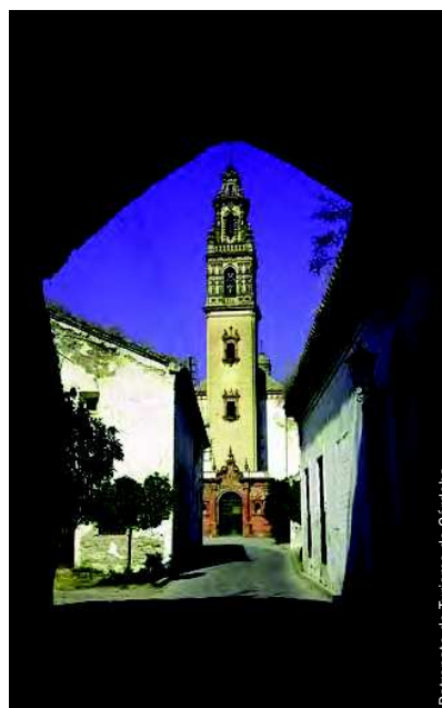
Vista de Palma del Río.