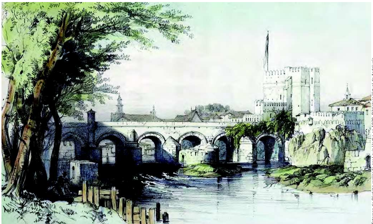
Estampa de Córdoba realizada por Louis Haghe en 1838. Biblioteca Virtual de Andalucía