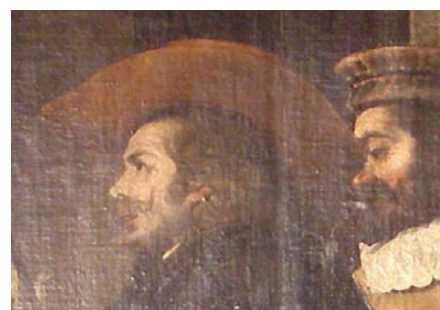
Figura 3: Miguel de Santiago y obrador: Detalle del Milagro de las ceras (convento de San Agustín de Quito, 1656)