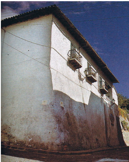
Figura 7: Casa de la Peña, donde se creía erróneamente que vivía Miguel de Santiago

batirse en duelo con él (Mera, 1861: 143). Esta anécdota reincide en el carácter pendenciero del pintor y se vincula con las anteriormente planteadas sobre sus relaciones con los oidores. A estas leyendas sobre la vida, la obra y la forma de comportarse del pintor cabe añadir una relativa al lugar donde vivió. Es sabido que Miguel de Santiago habitó unas casas en el Alto de Buenos Aires de la quiteña collación de Santa Bárbara, tal como declara el artista en su testamento. La Casa de la Peña, una de las viviendas coloniales más conocidas de la ciudad de Quito, fue considerada como la morada del pintor (fig.7), pero dicha afirmación carece de fundamento alguno, como supo ver Ortiz Crespo (2004, Vol. II: 298). Parece que en esa casa se estableció la “Escuela Democrática Miguel de Santiago”, motivo por el cual se extendió en la ciudad la creencia de que fue la casa que perteneció al artista, cuando nada tiene que ver con él. De hecho, Ortiz Crespo opina que más bien podría haberse construido ya en el siglo XVIII, cuando había fallecido el pintor, según se desprende del estilo de la casa, cuyas características pueden observarse en la fotografía que se aporta (Ortiz Crespo, 2004, Vol. I: 173).