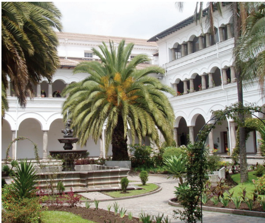
Figura 6: Claustro del convento de San Agustín de Quito, legendario refugio de Miguel de Santiago en caso de conflictos con la Justicia

Estas afirmaciones nacerían de la creencia entre los biógrafos de que las debilidades humanas del artista, en este caso de Miguel de Santiago, pervivirían en su obra, siendo ejemplo de cómo se intentó explicar la relación del artista con su obra basándose en los estímulos que procedían del modelo (Kris y Kurz, 1982: 103-104).