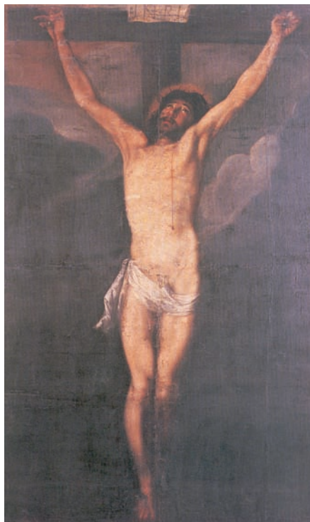
Figura 5: Anónimo: Cristo de la Agonía (Recoleta de El Tejar, Quito, siglo XVII)

exculpó aduciendo que el fin justifica los medios. Barrera refiere la misma leyenda, queriendo hacer ver que la misma da la clave sobre el temperamento del artista, algo inaceptable por ser esta tradición tardía, además de falsa. Este escritor ecuatoriano dice que Santiago “tenía la ira fácil y la espada pronta, para dar satisfacción a los hidalgos que la pidieran por su iracundia” (Barrera, 1979: 229). Terán (1950: 15) piensa que esta anécdota, al igual que la del oidor a que nos referiremos más abajo, está tomada de otra que circulaba sobre Pedro Pablo Rubens.