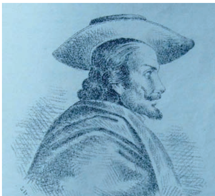
Figura 1: Miguel de Santiago. Dibujo de Garcés reproducido en el artículo que Juan León Mera dedicó a Miguel de Santiago (1861).