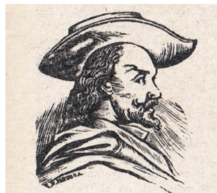
Figura 2: Miguel de Santiago según dibujo reproducido en “Resumen de Historia Patria” de Homero Villamil.

Las anteriores representaciones de Miguel de Santiago, tan similares entre sí y tan alejadas de la que debió de ser la verdadera apariencia del pintor quiteño, que por otra parte era indio, como ya hemos señalado, no son realmente invenciones decimonónicas 14 . El dibujante del volumen de Villamil copió a Garcés, pero éste, al igual que Joaquín Pinto en su dibujo de 1905, se basó en el caballero tocado con sombrero rojo que aparece en el primer plano del lienzo del Milagro del peso de las ceras , pintura perteneciente a la serie de San Agustín de Quito, pintada por Miguel de Santiago y su obrador 15 (fig. 3). Pero este supuesto autorretrato del pintor es el germen no sólo de la interpretación de Pinto, sino de todas las anteriormente mencionadas. Terán quiso ver el autorretrato de Miguel de Santiago en éste y en otro cuadro más de la serie de San Agustín (Terán, 1950: 16). Pérez Concha (1942: 90-91) también buscó su autorretrato en uno de los retablos de San Francisco. Concretamente, se ha identificado al pintor con el San Lucas que junto a San Marcos flanquean una pintura de La Anunciación en uno de los retablos del claustro del convento