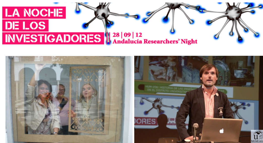
Presentación del Museo en la Noche de los Investigadores en el CICUS.

Tras su apertura, la noticia ha corrido por diferentes cauces informativos: entrevistas de radio, publicaciones en prensa, presencia en las redes a través de múltiples enlaces 4 .