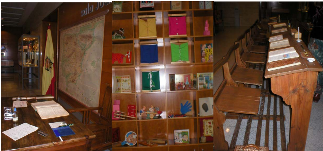
Imágenes de la exposición celebrada en la Sala Juan de Mairena