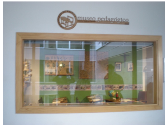
Logotipo y vista exterior del Museo

La ventana está flanqueada por un par de tabloneros acristalados que recogen parte de los resultados de nuestro proyecto. El de la derecha reúne cronológicamente los carteles de alguna de las exposiciones y eventos científicos que hemos ido organizando. Y el de la izquierda guarda trabajos de nuestro alumnado de Historia de la Educación que, de una manera u otra, toman como referencia el Museo, utilizando sus fondos y su idea fundamentalmente desde un punto de vista lúdico-didáctico. El propio enclave de estos tabloneros, en el exterior, evidencia cómo nos interesa hacer salir hacia afuera lo que se cuece en su interior.