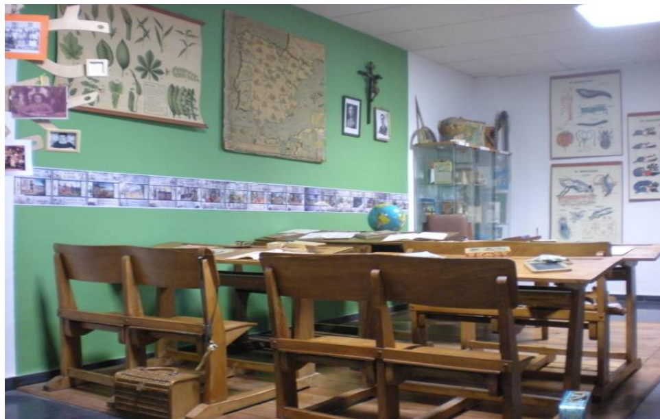
Recreación del aula

Sobre los escasos metros de pared con los que contamos, cuelgan mapas, láminas didácticas y los tres elementos imprescindibles en una clase de un colegio público del momento retratado: el crucifijo, la imagen de Franco y la de Primo de Rivera, éste último casi nunca reconocido por el alumnado, una señal más de que hay que rescatar datos perdidos. El telón se rubrica con un homenaje al Colegio Macarena, un centro histórico sevillano, fundado por la Real Maestranza de Caballería en 1895, edificio modelo, entre otras cosas, por los frescos didácticos pintados en cada una de sus aulas: una cenefa, originariamente instalada en el aula de primaria del Colegio, representa un abecedario, donde cada recuadro se dedica a una letra, muestra una palabra que comienza por ella, en minúsculas y mayúsculas, se ilustra con un dibujo y se practica en una frase.