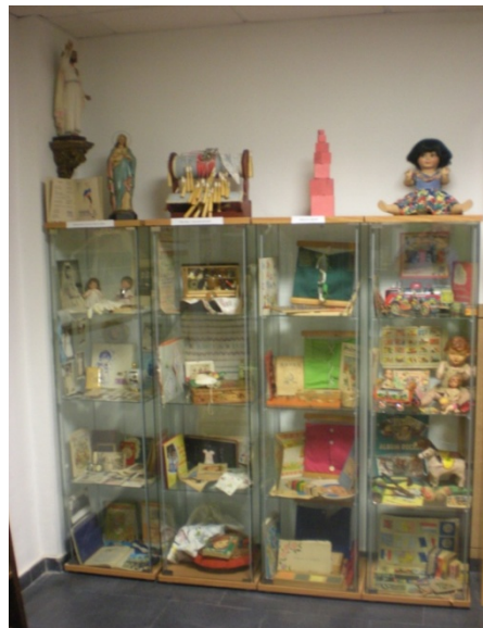
Vitrinas temáticas del museo

Aparte, en otras dos estanterías, se alinean un par de cientos de manuales escolares. Entre ellas, en una mesa expositora de moderno diseño (fruto, como otras piezas de nuestra infraestructura museística, de la colaboración con el Laboratorio de Fabricación Digital de la Universidad) acunamos, con más ternura si cabe, a algunas joyas del fondo antiguo de la Biblioteca de la Facultad, en especial varios manuales del Arte de Escribir, del siglo XVIII y otros libros raros y curiosos, formalmente muy atractivos.