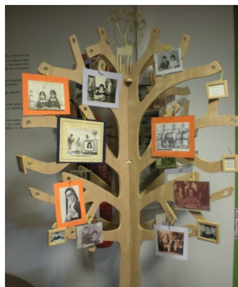
Árbol expositor de fotografías escolares

Y de las ramas de un árbol, construido también ex profeso para nuestro proyecto museístico, cuelgan típicas fotografías de “Recuerdo Escolar”, aquellas en las que se posaba, con cara de aplicación y de bondad, ante una mesa decorada con el atrezzo académico por excelencia (globo terráqueo, mapa, imágenes religiosas a veces) o con algún que otro aparato que simbolizara la modernidad de los tiempos (televisores, teléfonos) Una serie de marcos vacíos invitan además a quien está mirando a implicarse activamente, a rebuscar en los álbumes familiares para traer al Museo sus propias fotos, pasando a formar parte de él, no solo como espectadores de una obra ajena.