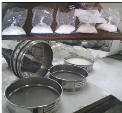
Figura 2. Muestras de Urea (arriba) y tamices empleados en la granulometría (abajo)

La granulometría del abono tiene una gran influencia sobre la curva de calibración obtenida posteriormente. Se ha realizado un análisis que nos permite conocer la distribución del tamaño de las partículas. Para ello se tomaron 5 muestras de aproximadamente 500 g. El abono se hace pasar por 5 tamices con diámetros decrecientes de 5 mm, 2mm, 1mm, 0,6 mm y 0,4 mm, y es pesada la cantidad retenida por cada uno ( Figura 2 ).