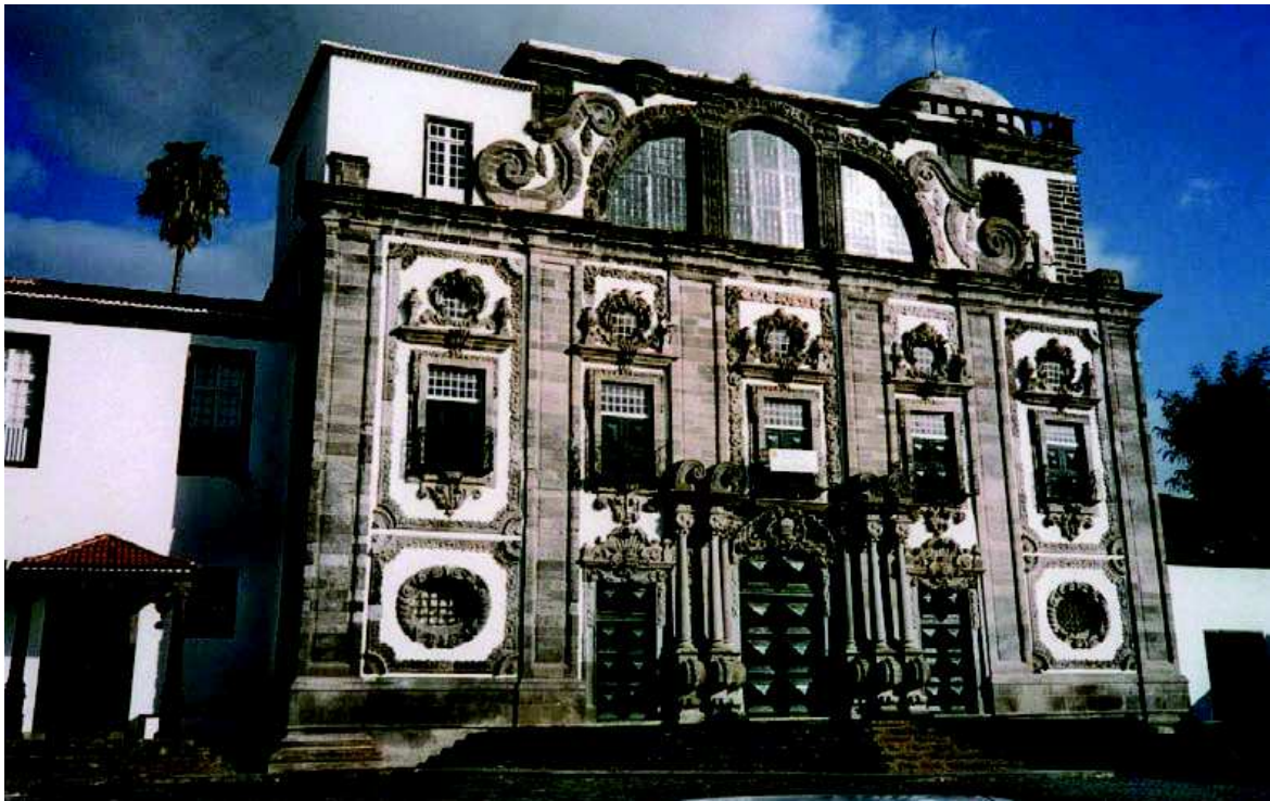
Fig. 4. Portugal. Azores. Ponta Delgada. Igreja de Todos los Santos, perteneciente al Colegio de la Compañía de Jesús. Fachada.