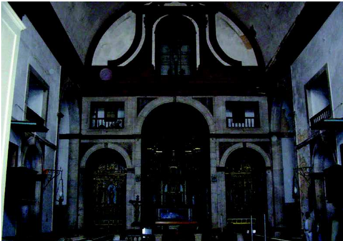
Fig. 5. Portugal. Portimão. Iglesia del Colegio de la Compañía de Jesús. Interior. Vista del altar mayor.