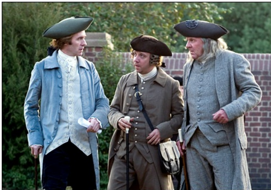
Figura 3: Fotograma de los Padres Fundadores en 'John Adams'. De izquierda a derecha: Thomas Jefferson (Stephen Dillane), John Adams (Paul Giamatti) y Benjamin Franklin (Tom Wilkinson).

A diferencia de las películas de Hollywood sobre el período, la temática de 'John Adams' no es la guerra revolucionaria, sino todo el período que se extiende desde los antecedentes de la Revolución (concretamente, desde la masacre de Boston en 1770), el debate sobre la independencia (con la guerra como trasfondo) y la construcción nacional (con un capítulo dedicado a la presidencia de Washington y otro a la de John Adams), y finalmente, llega hasta la muerte de Jefferson y Adams, el 4 de julio de 1826, cuando se cumplían 50 años de la Declaración de Independencia [7].