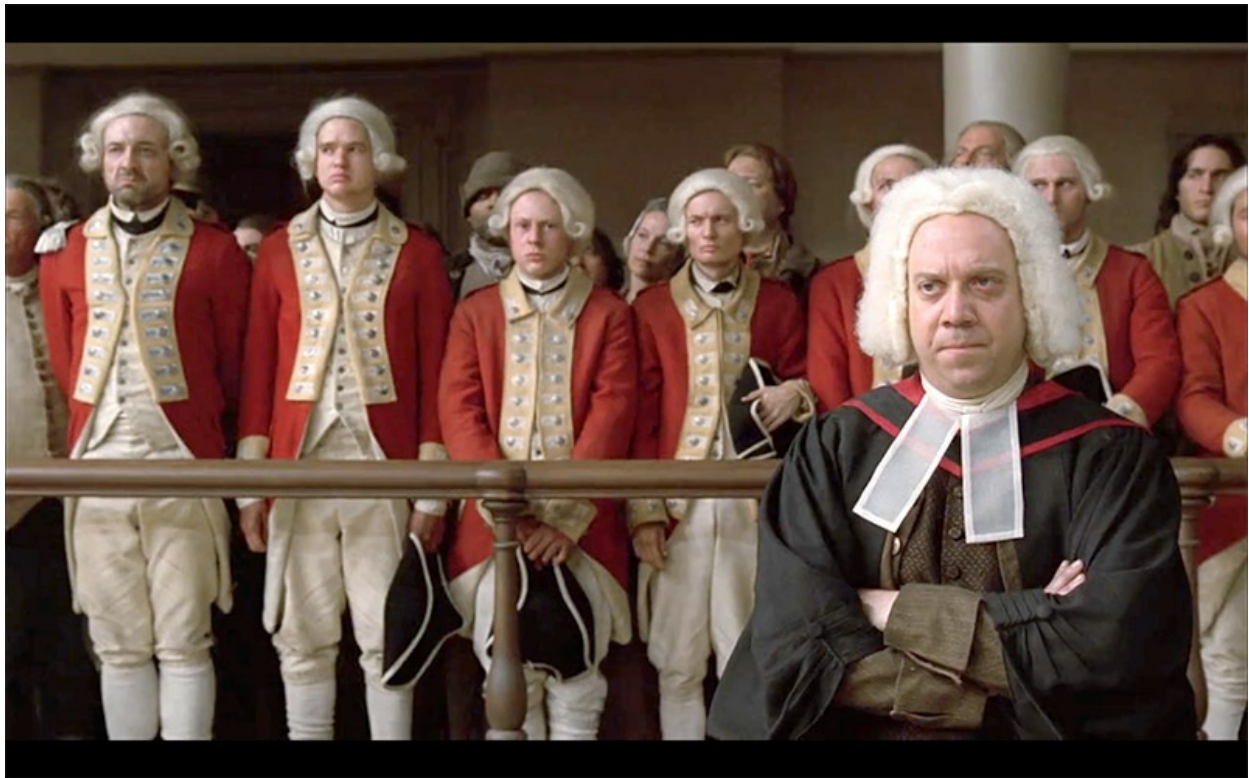
Figura 4: La masacre de Boston. “La masacre sangrienta perpetrada en King Street” de Paul Revere (1770). Fotograma de ‘John.

Sin embargo, en su homenaje a la memoria de la Revolución americana, la miniserie omite o no profundiza en algunos de los asuntos más controvertidos del período, al igual que sucede con las películas de Hollywood. Tal vez el más significativo es la escasa incidencia en la vertiente de guerra civil de la Revolución americana, que fue tanto una guerra contra el imperio británico, como un enfrentamiento civil de lo más cruento entre patriotas y tories –como se llamaba a los que permanecieron leales a la corona– [10]. Ésa es también la tónica dominante en las películas clásicas de Hollywood sobre la Revolución, excepto en ‘América’ de Griffith –curiosamente la primera representación audiovisual sobre el período revolucionario todavía en tiempos del cine mudo– y en parte también, en ‘Revolución’ y ‘El patriota’, las dos películas más recientes entre las citadas. Los demás filmes omiten la violencia del enfrentamiento civil, y si aluden a la confrontación, es mediante tramas amorosas entre patriotas y tories , estrategia narrativa que también adoptan ‘Revolución’ y ‘El patriota’.