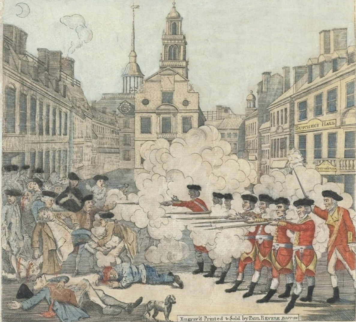
Engrav'd Printed & Sold by PAUL REVERE BOSTON

Unhappy Boston! see thy Sons deplore, Thy hallow'd Walks beincur'd with guiltless Gore While faithless P—n and his savage Bands, With murderous Rancour stretch their bloody Hands; Like fierce Barbarians grinning o'er their Prey, Approve the Carnage and enjoy the Day.