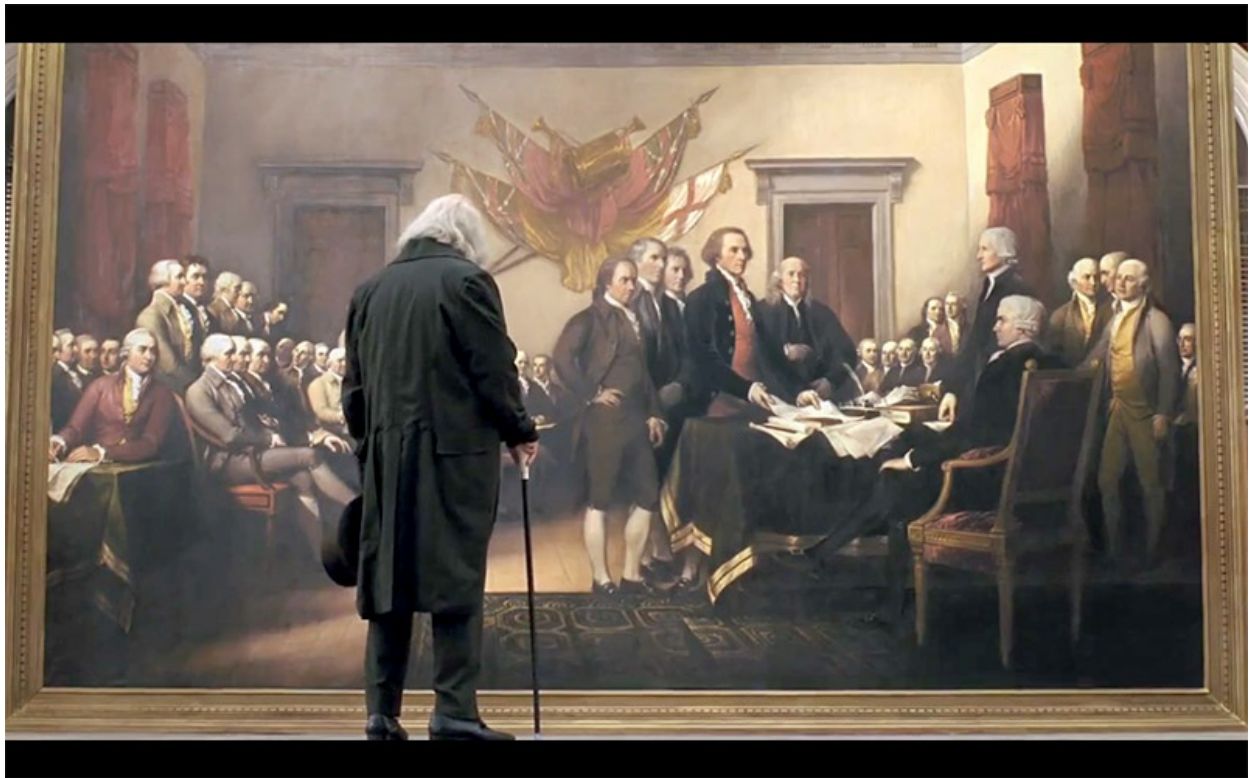
Figura 5: John Adams contempla el cuadro de Trumbull que inmortaliza la firma de la Declaración de Independencia en una escena de la miniserie.