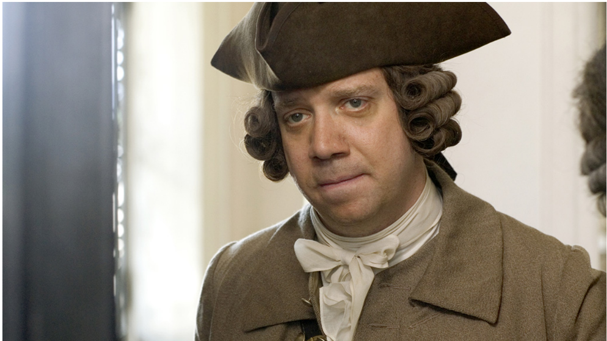
Figura 6: Paul Giamatti caracterizado como John Adams en la miniserie de HBO.

En sentido contrario, se excluyen del relato los hechos en los que el personaje no tuvo protagonismo. Por esa razón, no presenciamos la masacre de Boston sino el anticlímax, con Adams asistiendo a los heridos; tampoco se recrean episodios bélicos, dado que él solo intervino en la guerra desde los despachos; y otro tanto ocurre con la redacción de la Constitución que, pese a su importancia, solo se aborda desde la distancia en la etapa de Adams como embajador en Europa. Y desde luego, el período más desdibujado es el relativo a los gobiernos de George Washington, abordados en el quinto episodio (“Unite or Die”) a través del escaso protagonismo que John Adams tuvo como vicepresidente durante su administración.