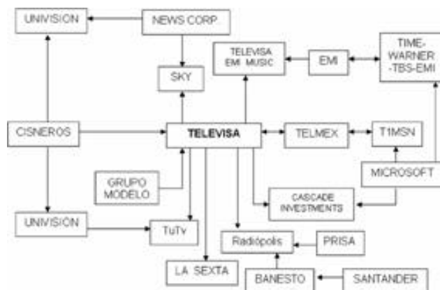
Cuadro 3. Relaciones de Televisa con otras estructuras de poder en México y en el mundo.

Las relaciones con Telmex son complejas, pues además de ser Carlos Slim dueño de la tercera parte de acciones del Grupo, son varios los negocios que ambas empresas mantienen en comunión.