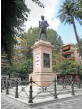
Monumento a Daoíz. Sevilla

5. ¿Por qué se representa la muerte de forma tranquilizadora? Enumera los elementos decorativos que se han empleado para decorar la verja.