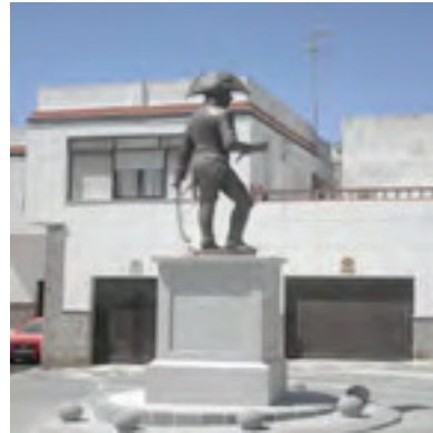
Monumento al General Copóns. Tarifa 2012.

Es una escultura monumental de gran simbolismo pues el contraposto natural representa la humildad de un pueblo y su corta guarnición que simplemente pretende hacerse fuerte en sus convicciones y de cuyas raíces históricas brota su propia idiosincrasia y compromiso para con sus ancestros y su propio devenir histórico. De estas virtudes emerge una mirada casi lacerante, un sentimiento de indignación al verse subestimado por el vilipendio de la carta del general francés. Es una figura gallarda entre humilde y heroica pero nunca arrogante. El escultor ha tratado de lograr que Copóns sea una persona correcta y respetuosa con el adversario pero nunca próxima a lo abyecto conforme a la disciplina castrense de la época. Ha intentado traducir la heroicidad de una ciudad que con murallas medievales desafió a la artillería napoleónica. El proyecto hoy feliz realidad ha intentado recoger los sentimientos de un pueblo honrando su historia y llevando sus sensaciones al bronce. Una escultura en disposición vertical para no entorpecer la correcta ordenación del tráfico y con una altura similar a la de la muralla de entonces. 202