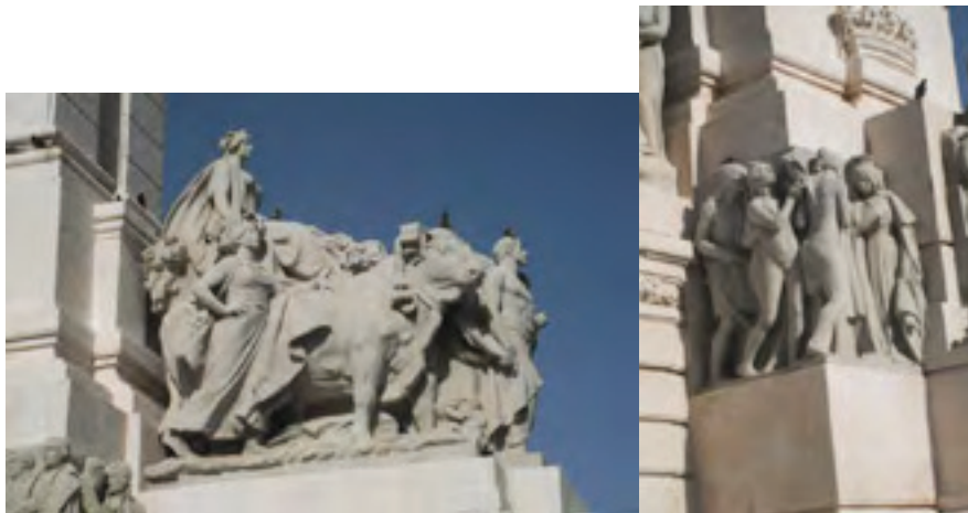
Detalles del monumento a las Cortes. Agricultura y América.

flanqueado por dos leones y columnas (escudo de Cádiz). A la derecha de Hércules, un altorrelieve simboliza América por medio de un grupo de personajes Colón ofreciendo sus presentes a la reina Isabel la Católica por mediación de los indios que trajo consigo. El otro grupo escultórico situado a la izquierda de Hércules simboliza la ciudad de Cádiz por medio de un grupo de diputados vestidos a la usanza de la época. 201