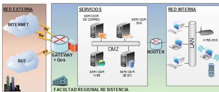
Fig. 2. Topología de red de la FRRe

La Red Universitaria Tecnológica (RUT) vincula con enlaces dedicados a las 29 Facultades Regionales (FR) en todo el país, al mismo tiempo, la RUT es un nodo de la red Asociación de Redes de Interconexión Universitaria (ARIU), que vincula a todas las Universidades e Instituciones Asociadas y representa el nexo con la Red de Prestaciones Avanzadas CLARA de Sudamérica (Internet 2).