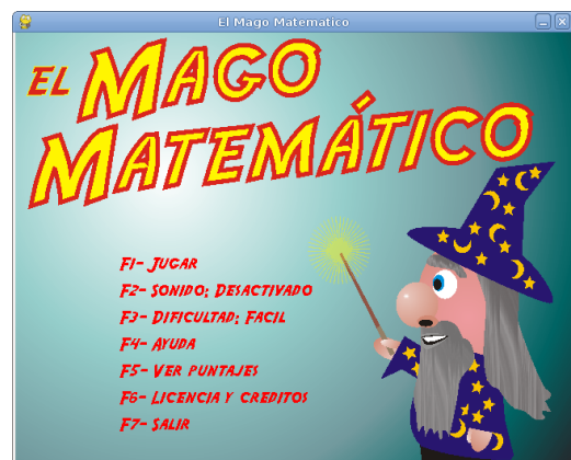
Figura 3: Juego de matemática desarrollado por el Grupo 5