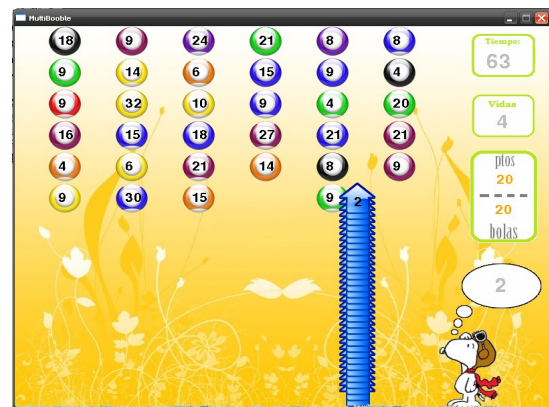
Figura 4: Juego de matemática desarrollado por el Grupo 14

Los primeros dos trabajos están relacionados con temáticas de la asignatura Lengua, en el primero, se debe saltar sobre las palabras bien escritas, restando puntos y vidas en el caso de caer al vacío o sobre palabras con errores ortográficos. Se suman o se restan puntos si se captura objetos con tales fines. En el segundo ejemplo, el objetivo del juego es practicar la separación de sílabas. Las