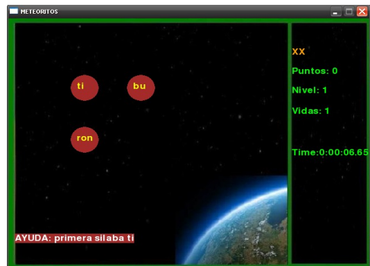
Figura 2: Juego de ortografía desarrollado por el Grupo 7