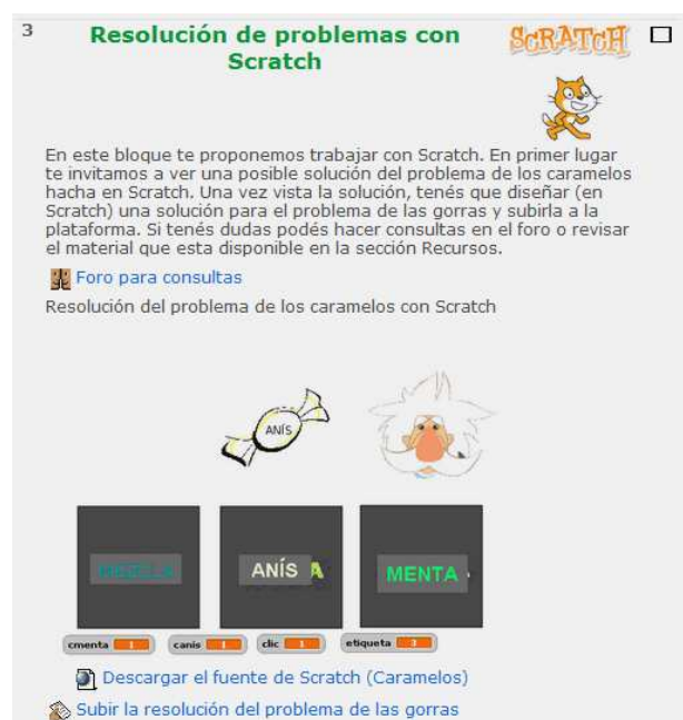
Figura 4. Parte del Bloque 3 del curso.

problema. Luego, se da una muy breve descripción del ambiente de trabajo de Scratch, y se analizan un par de programas sencillos diseñados en Scratch. Uno de los programas está terminado y es analizado en conjunto con el grupo-clase y luego probado por los alumnos, mostrando nuevamente como los expertos resuelven un problema. El otro ejemplo, sólo tiene una parte funcional y los alumnos deben analizar el funcionamiento y completar la parte que falta (adaptar una solución conocida a otro problema). Como tarea se les deja a los alumnos la solución de uno de los problemas planteados en las lecciones en el bloque 2. Esto tiene como finalidad que los alumnos se habitúen al uso de la herramienta y no sumar complejidad a través de nuevos problemas. Los programas entregados son evaluados (no calificados) y se les hace una devolución personalizada (a través de la plataforma), y se invita a aquellos alumnos cuyo programa no está del todo correcto a volver a remitirlo. Conformando así otra instancia de evaluación formativa.