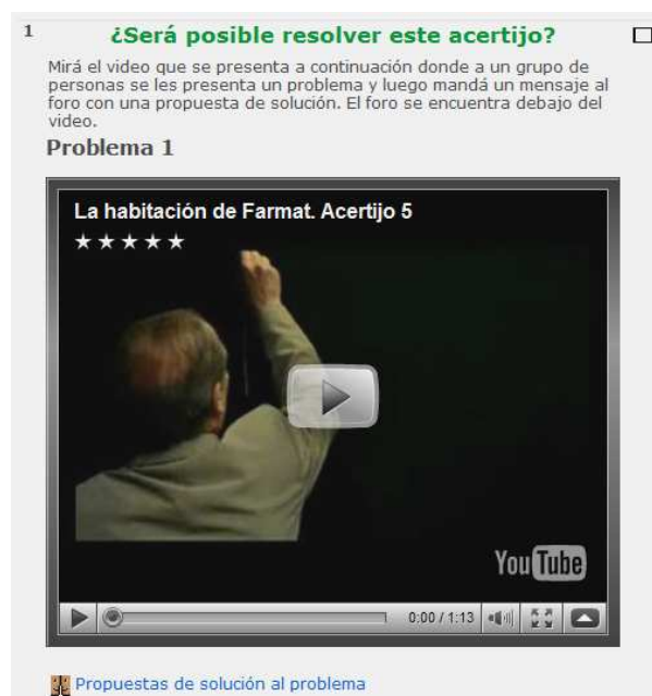
Figura 2. Parte del Bloque temático 1 del curso.

española La habitación de Fermat 3 en los que se presentan a los personajes dos acertijos (uno en cada enlace). Además, para cada video hay un foro donde los alumnos deben hacer una propuesta de solución. El tipo de foro elegido es preguntas y respuestas que sólo muestra las respuestas si previamente se realiza un aporte al foro. Esto permitió que los alumnos hicieran su primer aporte sin contaminarse con las respuestas de los demás. Para luego, tener acceso a las respuestas y contrastar su aporte con el de los demás alumnos. Cada aporte tuvo una respuesta por parte de los docentes, con el fin de alentar a quienes daban una respuesta correcta y de guiar a un mejor planteo o resolución a quienes no respondían correctamente. Este bloque se extendió durante 2 semanas, poniéndose visible un acertijo por semana.