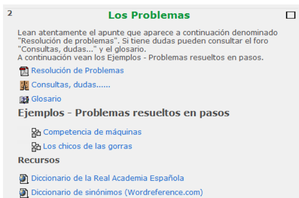
Figura 3. Bloque 2 del curso.

alumnos debían leer el documento para interiorizarse del método y tenían un foro para realizar consultas. Como ejemplo de aplicación del método de Polya, los alumnos pueden seguir dos lecciones (resolución por expertos). Estas lecciones cuentan además con preguntas que el alumno debe responder para acceder al paso siguiente. En consonancia con lo que Polya plantea para la primera fase de la resolución de un problema (comprender claramente el enunciado), los alumnos cuentan con un glosario y enlaces a la página de la Real Academia Española y al diccionario de sinónimos Wordreference.com para resolver sus dudas si es que tienen dificultades en la comprensión de los enunciados de los problemas presentados.