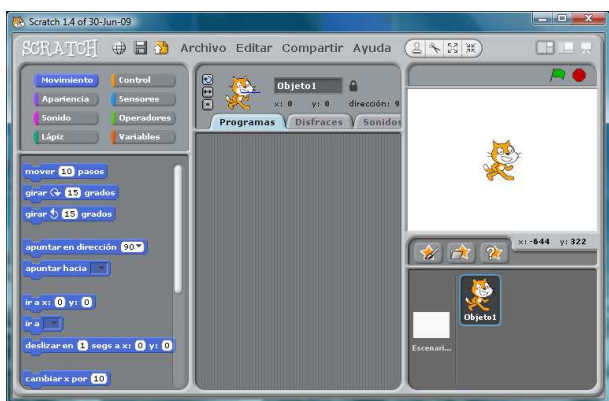
Figura 1. Ambiente de trabajo de Scratch

un poco desordenado y experimentar. Con Scratch es posible experimentar de modo desordenado, pero también crear de modo planificado y ordenado. Existen ya varias experiencias de utilización de Scratch como recurso pedagógico (Crook, 2009; Peppler & Kafai, 2007), y no es difícil anticipar que será utilizado en muchas más experiencias de docencia e investigación.