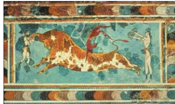
Foto 1.- Arte Cretense. 1500 a. C Palacio del Rey Minos en Cnosos (Creta)

Como antesala o precedente del juego objeto de estudio, mostramos el momento en el que un joven salta por encima de un toro, agarrado a sus cuernos. (Foto 1)