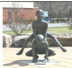
Fotos 19, 20 y 21.-Arte Urbano y juego