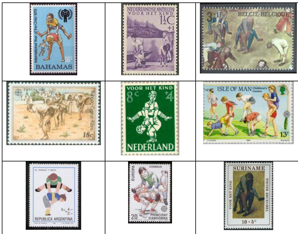
Imágenes de la 8 a la 16.- Filatelia y juego popular del salto de pídola

A través de la filatelia y dentro de la modalidad de colección temática, podemos encontrar una gran cantidad de juegos populares, en este caso presentamos el salto de pídola representado en esta miniatura de papel engomado. (Imágenes de la 8 a la 16)