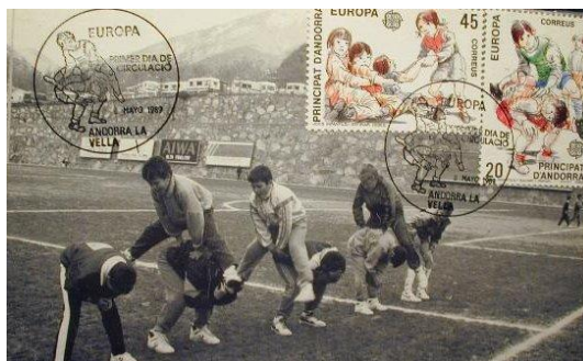
Fotos 17 y 18.- Salto de pídola