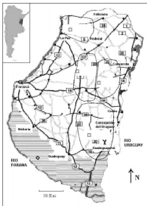
Figura 1. Áreas de estudio: Área 1. Rutas 18, 22 y 38 (Departamentos Villaguay, Federal, Concordia y San Salvador); Área 2. Rutas 20 y 39 (Departamentos Villaguay, Concepción del Uruguay, Colón y Gualeguaychú); Área 3. Rutas 6, 18 y 20 (Departamentos Villaguay y San Salvador); y Área 4. Rutas 1 y 2 (Departamento La Paz).

Study Areas: Area 1. Routes 18, 22 and 38 (Departments Villaguay, Federal, Concordia and San Salvador).; Area 2. Routes 20 and 39 (Departments Villaguay, Concepción del Uruguay, Colón and Gualeguaychú); Area 3. Routes 6, 18 and 20 (Department Villaguay and San Salvador) and Area 4. Routes 1 y 2 (Departament La Paz).