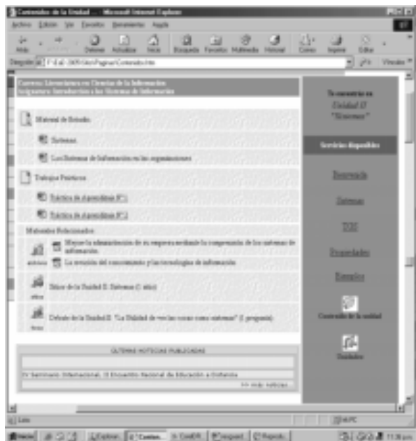
Figura 5- Página del vínculo Contenidos de la Unidad

Se cree que una vez que el alumno ha accedido a los conceptos fundamentales de Sistemas, está en condiciones de hacer uso de lo que Chadwick, en Fainholc Beatriz, denomina estrategias de procesamiento, entendidas como “aquellas que se utilizan para asegurar un proceso de captación e ingreso de nueva información, destrezas, habilidades y su almacenamiento exitoso en la memoria permanente” [5]