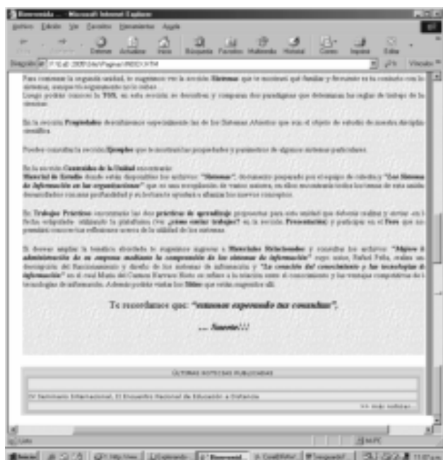
Figura -3 – Hoja de Ruta en la Página de Bienvenida

En las estrategias de desarrollo, se proporciona la organización y secuencia sugerida (Hoja de ruta) para el recorrido por el material publicado en la plataforma. Esta hoja de ruta es la guía para orientar a los alumnos en el estudio de cada unidad, y trata de imitar la acción del docente en la modalidad presencial (ver Figura 3).