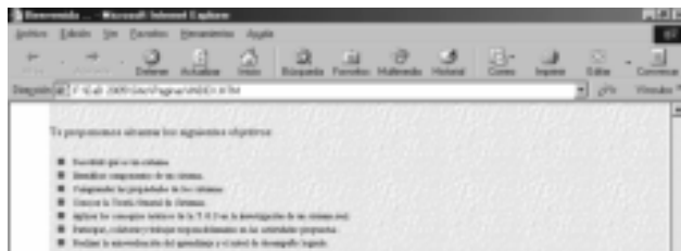
Figura 2- Objetivos de la Unidad en la Página de Bienvenida

En la misma página se enuncian los objetivos de la unidad y se da una visión global de los contenidos de la misma. (Ver figura 2)