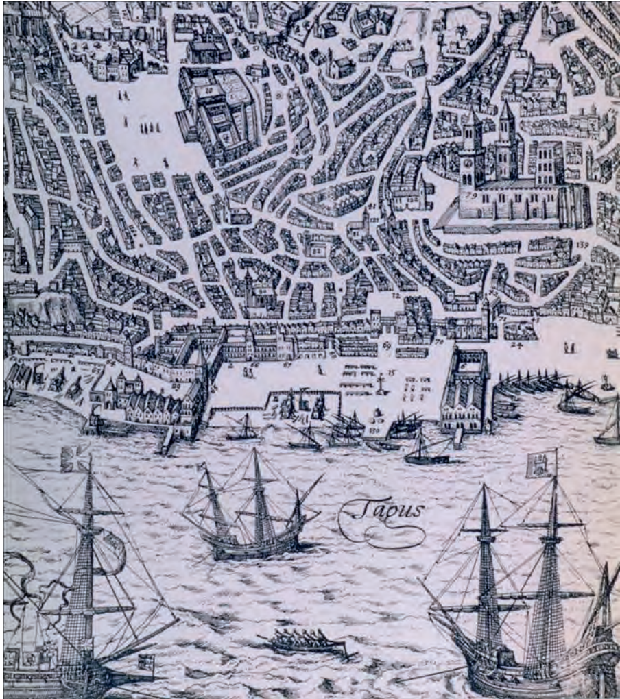
Baixa de Lisboa (pormenor de gravura do livro de Georgius Braunius, Urbium Praecipuarum Mundi Theatrum Quintum , 1598)