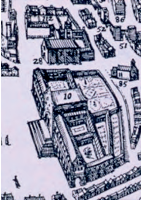
Hospital de Todos os Santos e Igreja de S. Domingos (pormenor da gravura do livro de Georgius Braunius atrás referido)

Portas do Mar, concentrava grande parte dos locais de hospedagem [63] , e isso permitiu ao viajante aperceber-se, nos poucos dias em que nela permaneceu, de muitos dos seus aspetos mais significativos. E igualmente ver muitos locais e edifícios, provavelmente na companhia do filho, que lhe serviu de guia.