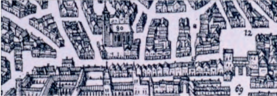
Rua Nova dos Mercadores (pormenor da gravura do livro de Georgius Braunius atrás referido)

petiva posição social [69] . O código manuelino, no entanto, veio a prever a necessidade da queixa do ofendido, e um regime especial para quando o adúltero fosse fidalgo, cavaleiro ou escudeiro e o marido peão. Nesses casos, a pena não seria executada sem conhecimento do rei e sua autorização [70] . Se fosse o marido ultrajado a matar a mulher adúltera e o amante, essa vingança ser-lhe-ia relevada – aqueles que (...) por tal razom matarem nom hajam medo, nem se catem de mim, nem da minha justiça – se ele fosse cavaleiro ou fidalgo de solar (nas Ordenações afonsinas ) ou fidalgo de solar, desembargador ou pessoa de maior qualidade (pelas Ordenações manuelinas ). Se, no entanto, o que matasse fosse peão e homem de pequeno estado e o culpado de condição superior, o resultado seria mais grave: não seria morto, mas seria degredado um ano para algum lugar do estremo (nas Ordenações afonsinas ) ou d'Além (praças do Norte de África) (nas Ordenações manuelinas ) [71] .