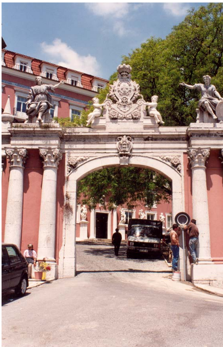
Hospital São José, Lisboa