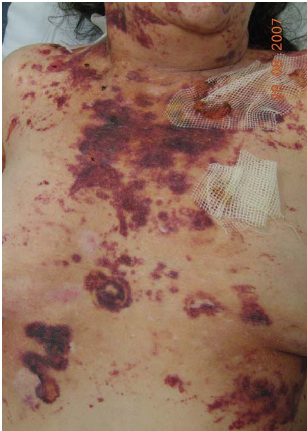
Fig. 2 – Equimoses da face anterior do tórax

laboratorial efectuada no Serviço de Urgência (leucograma, hemograma, bioquímica e coagulação) era normal.