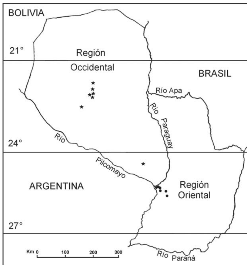
Figura 1. Mapa de Paraguay mostrando la localización de los ejemplares revisados. Círculos: Phalotris matogrossensis . Estrellas: P. tricolor .

El ejemplar más pequeño de P. matogrossensis midió 204 mm de longitud total, mientras que el más grande midió 646 mm (Tabla 1). En cuanto a P. tricolor , el ejemplar más pequeño y más grande midieron 213 mm y 661 mm de longitud total respectivamente. En P. matogrossensis el rango de escamas