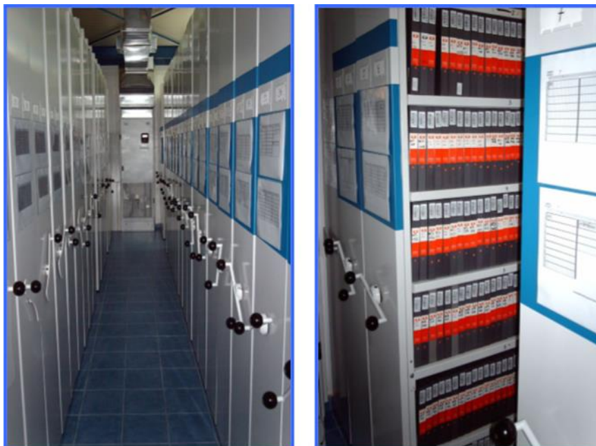
Figura 7: Depósito de cassetes do Arquivo Audiovisual da SIC