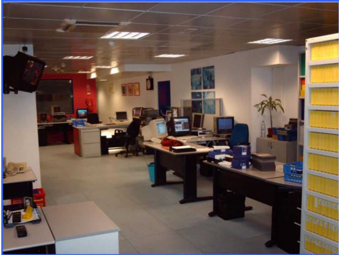
Figura 2 Instalações do Arquivo Audiovisual da SIC

Enquanto funções e atividades desenvolvidas, compete ao Arquivo Audiovisual da SIC, gerir o ciclo de vida completo da informação produzida, desde a sua criação até á atribuição de um destino final, incluindo a recolha, organização, classificação, descrição, indexação, disseminação, avaliação e seleção, eliminação ou conservação permanente. Compete-lhe ainda construir uma coleção ativa de conteúdos e recursos de informação baseados nas necessidades dos utilizadores e dos seus processos de trabalho, respeitando disposições contratuais, direitos de autor e obrigações morais exigidas pela natureza da própria coleção.