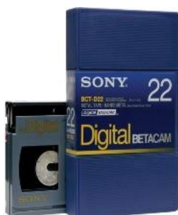
Figura 4: cassette de fita magnética Betacam Digital