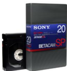
Figura 3: cassette de fita magnética Betacam SP

No que diz respeito aos suportes, o AV utiliza fitas magnéticas do tipo Betacam SP, Betacam SX e Betacam Digital (ver imagens em baixo). No que diz respeito aos formatos, são utilizados os formatos MPEG2 ( software Sony NewsBase, vídeos de alta resolução) e MJPEG ( software Sony NewsBase Clip Edit, vídeos de baixa resolução).