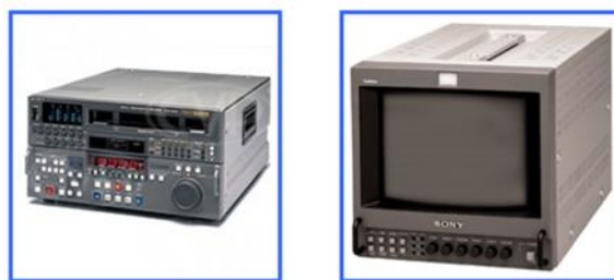
Figura 1: Equipamento de leitura de timecodes