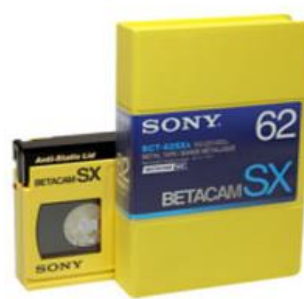
Figura 5: cassette de fita magnética Betacam SX

Relativamente às soluções de software utilizadas no AV, elas são as seguintes: