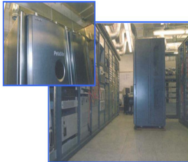
Figura 6: Equipamento Sony Petasite

módulo e cada prateleira possuem um número sequencial de forma a identificar a localização de determinada série. O depósito é devidamente controlado relativamente à humidade, que é de cerca de 30%, e a temperatura ronda os 18 graus. 30