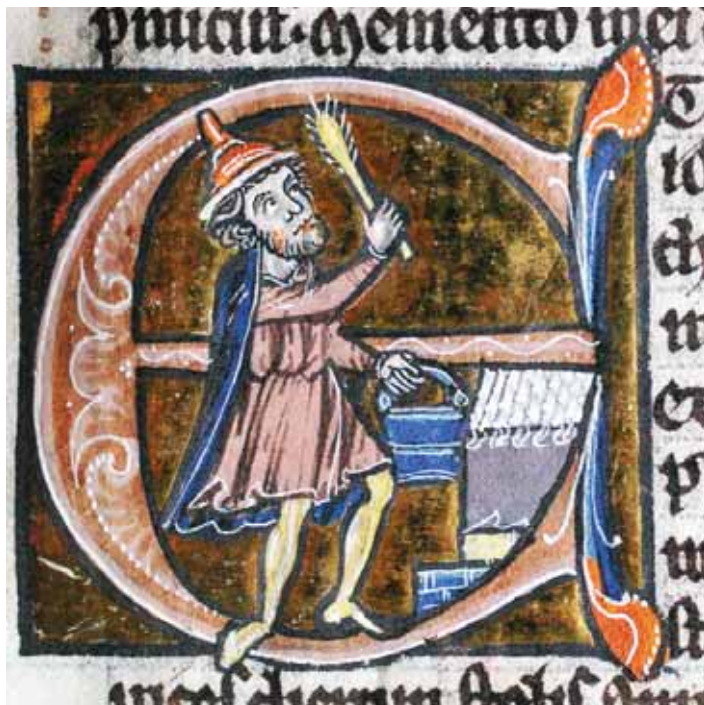
FIG.7 ASPERSÃO DO ALTAR. INICIAL "E" DO LIVRO II DE ESDRAS, LISBOA, BNP, ALC.455, FL.152

Se nas polémicas Adversus Judaeos , numa atitude que remonta a Santo Agostinho 4 , os judeus são considerados como os responsáveis pela morte de Cristo, nas representações bíblicas em análise, aquele povo é representado numa atitude de polémica intelectual, de encontro com os cristãos ou numa referência ao Antigo Testamento.