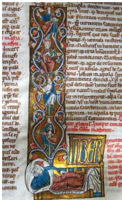
FIG.9 ÁRVORE DE JESSÉ. INICIAL “L” DO EVANGELHO SEGUNDO S. MATEUS, BÍBLIA, LISBOA, BNP, ALC. 458, FL. 284V