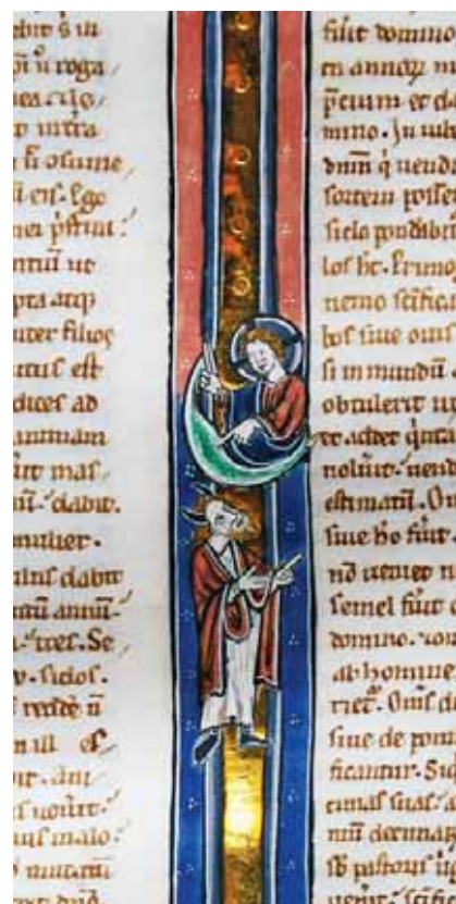
FIG.4 DEUS E MOISÉS: “O SENHOR FALOU A MOISÉS NO DESERTO DO SINAI”. INICIAL “L” DO LIVRO DOS NÚMEROS, BÍBLIA, LISBOA, BNP, ALC. 458, FL.37V