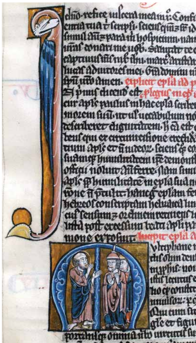
FIG.14 S. PAULO E DOIS JUDEUS. INICIAL "M" DA CARTA AOS HEBREUS, BÍBLIA, LISBOA, BNP, ALC.455, FL.380

A Epístola aos Hebreus, cuja autoria é atribuída a S. Paulo, pela tradição das Igrejas Orientais, terá sido dirigida a uma comunidade de cristãos que não é explicitada. A inicial que abre esta carta nos manuscritos Alc.455, Alc.458 e no IL 34, apresenta sempre a mesma iconografia: S. Paulo dialogando com judeus (fig. 14 e 15). A sua