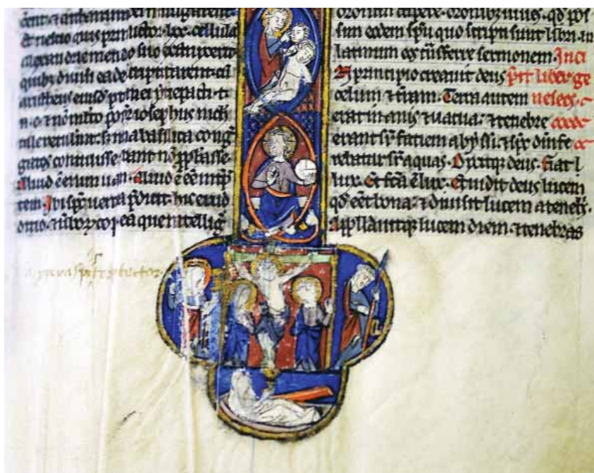
FIG.16 CALVÁRIO COM REPRESENTAÇÃO DA IGREJA E SINAGOGA, COIMBRA, BGUC, COFRE 5, FL. 4

É interessante comparar esta imagem (fig. 16) com a da bíblia moralizada de Viena, Österreichische Nationalbibliothek, Cod. Vindobonensis, 2554, fl. 31v e 36v (fig. 17 e 18). Neste manuscrito, partindo de uma passagem do Livro I de Samuel (1 Sam. 6, 10-12), a Igreja surge triunfante, coroada, aureolada e transportada em carro conduzido por dois dignitários da Igreja, circundada pelos símbolos dos evangelistas, erguendo o estandarte e elevando o cálice (fig. 18). Há, pois, a intenção de condenar o judaísmo, do ponto de vista teológico. Entre os dois manuscritos, produzidos num período próximo, verifica-se uma forma diversa de abordar o tema da Sinagoga: o manuscrito universitário, embora nele a “Sinagoga” vire as costas a Cristo crucificado, não o reconhecendo como divindade, aproxima-se das representações do tema, tal como este aparece tratado na época carolíngia, em que aquela surge sem qualquer sinal de inferioridade; na bíblia moralizada 5 transmite-se uma mensagem de vitória de Cristo/Igreja sobre a Sinagoga, em que esta é representada derrotada e humilhada.