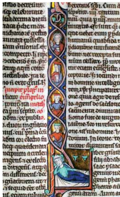
FIG.10 ÁRVORE DE JESSÉ. INICIAL “L” DO EVANGELHO DE S. MATEUS, BÍBLIA, LISBOA, BNP, IL 51, FL.268