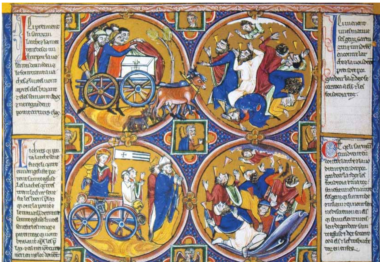
FIG.18 IGREJA TRIUNFANTE E CONDENÇÃO DOS ÍMPIOS, SENDO ABOCANHADOS POR LEVIATHAN, BÍBLIA MORALIZADA, VIENA, ÖSTERREICHISCHE NATIONALBIBLIOTHEK, CODEX VINDOBONENSIS 2554, FL. 36V

No último exemplo que seleccionámos (fig. 18 – medalhões da direita), de acordo com o sentido do texto, os Judeus simbolizam os ímpios e os que põem em causa a Igreja, sendo lançados no inferno, aqui figurado na boca de um animal mons-