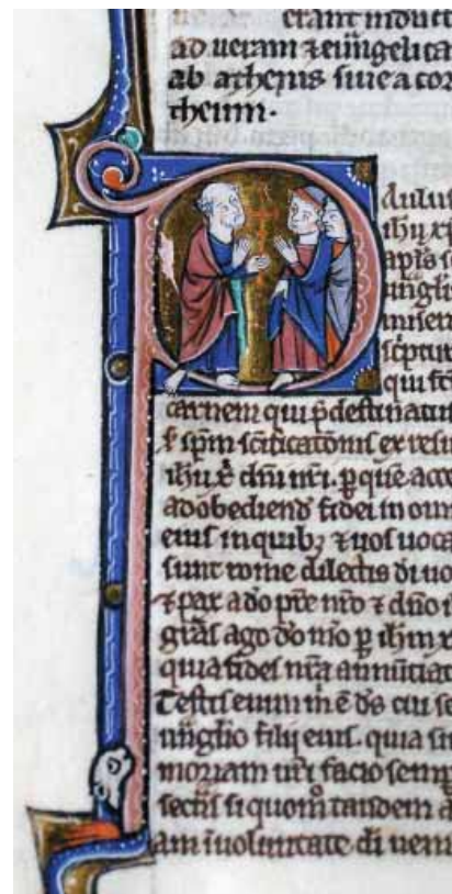
FIG.13 S. PAULO E DOIS JUDEUS. INICIAL "P" DA CARTA DE S. PAULO AOS ROMANOS, BÍBLIA, LISBOA, BNP, IL 51, FL.334V