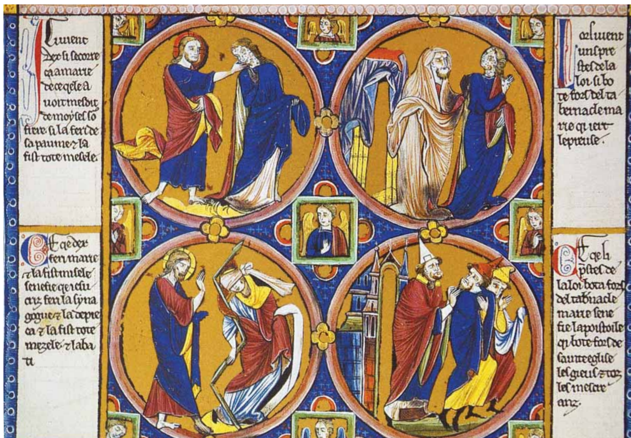
FIG.17 IGREJA DE CRISTO E A SINAGOGA E A EXPULSÃO DOS JUDEUS DO TABERNÁCULO, BÍBLIA MORALIZADA, VIENA, ÖSTERREICHISCHE NATIONALBIBLIOTHEK, CODEX VINDOBONENSIS 2554, FL. 31V

A moralização refere: “A expulsão de Maria do acampamento, significa o papa que expulsa da Igreja os Judeus e os infames”