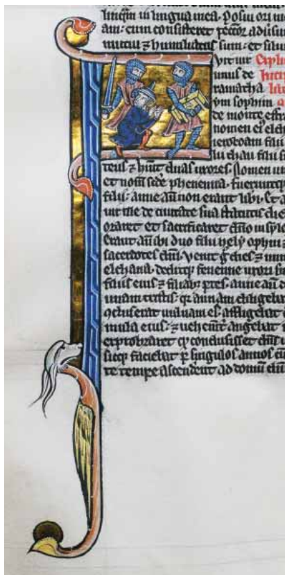
FIG.5 O ROUBO DA ARCA DA ALIANÇA AOS JUDEUS. LIVRO DOS REIS. LISBOA, BNP, ALC.455, FL.81V

Entre os profetas menores, muitos são representados, naturalmente, com atributos judaicos, veja-se por exemplo o pileum cornutum nas iluminuras do Livro de Sofonias nos Ms. IL 51, fl.275v, Alc. 458, fl. 264; Livro do profeta Amós, nos manuscritos