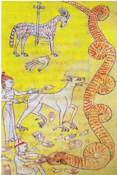
FIG.2 A VITÓRIA DO CORDEIRO. APOCALIPSE DO LORVÃO, LISBOA, ANTT, LORVÃO 43, CF160, FL.191

e os judeus que o veneram. A aproximação parece ser sublinhada pela utilização da cor vermelha, que aparece nos chapéus dos judeus ( pileum cornutum ) e no corpo da serpente marinha, símbolo do mal. O manuscrito, produzido no mosteiro do Lorvão pelo monge Egeias, surge ligado à resposta do mundo monástico laurbanense face ao avanço dos almorávidas e como afirmação de uma ideologia moçárabe. Estes, considerados os infiéis que adoram as forças do mal, todavia, eram representados não como muçulmanos mas como judeus, mostrando assim, de certo modo, uma atitude antijudaica.