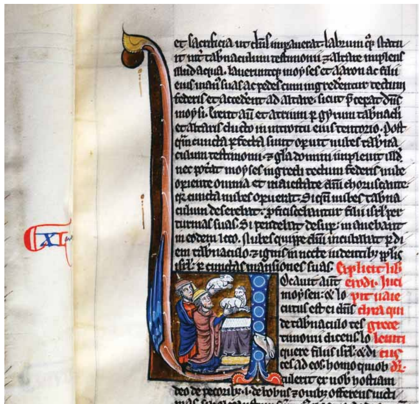
FIG.6 SACRÍFÍCIO. INICIAL "V" DO LIVRO DO LEVÍTICO, BÍBLIA (1220-30), LISBOA, BNP, ALC. 455, FL.31