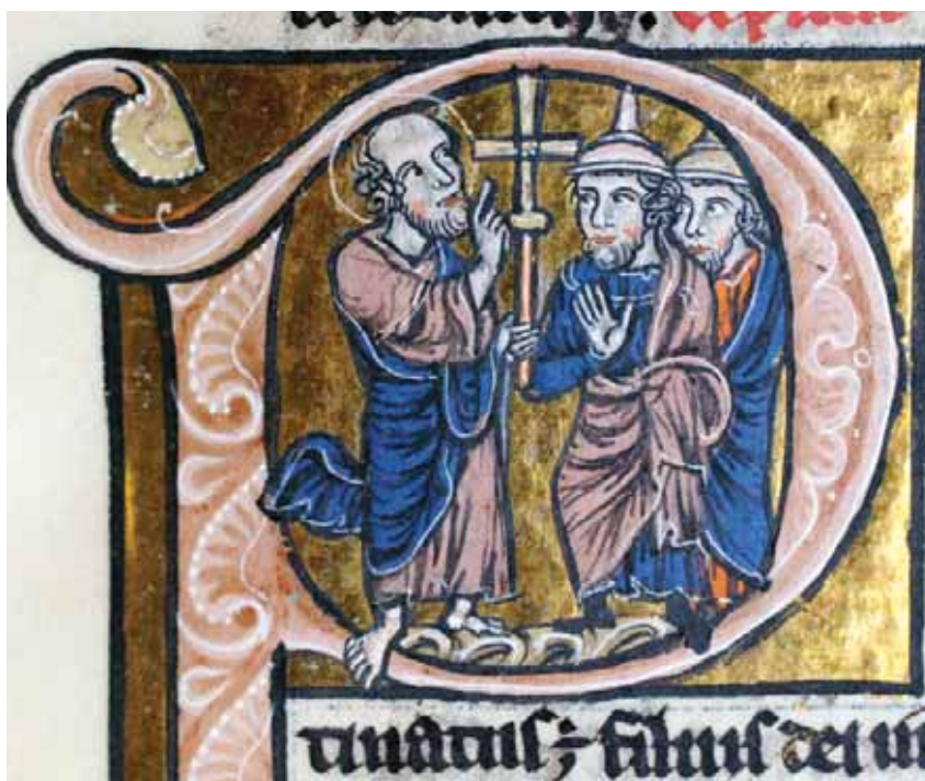
FIG.11 S. PAULO E DOIS JUDEUS. INICIAL "P" DA CARTA DE S. PAULO AOS ROMANOS, BÍBLIA, LISBOA, BNP, ALC.455, FL.361

Alguns da controvérsia entre a Nova e a Antiga Lei está bem patente no livro dos Actos dos Apóstolos (Act. 15), atribuído a S. Lucas, nomeadamente as dúvidas e insegurança dos primeiros cristãos sobre a necessidade de observância da lei mosaica. Nas cartas de S. Paulo, esse debate persiste e assume, na iconografia das iniciais, um verdadeiro lugar de confronto ideológico, como se pode observar nas iniciais P da Carta de S. Paulo aos Romanos, Alc. 455 fl. 361, da Carta de S. Paulo aos Hebreus, fl. 380 e Alc. 458 fl 342, da Carta de S. Paulo aos Colossenses fl.365 e da Carta aos Coríntios fl. 331v deste mesmo manuscrito. Nas iniciais que abrem as Carta aos Romanos (fig. 11) e aos Colossenses, S. Paulo, indubitavelmente uma personagem maior do Novo Testamento, ergue significativamente a cruz, símbolo cristológico por