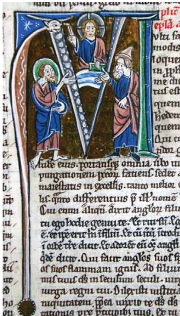
FIG.15 CRISTO, S. PAULO E UM JUDEU. INICIAL "M" DA CARTA DE S. PAULO AOS HEBREUS, BÍBLIA, LISBOA, BNP, ALC. 458, FL. 342