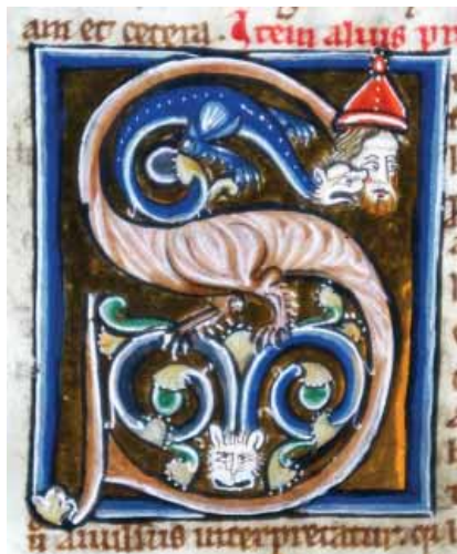
FIG.1 DROLERIE. INICIAL "S" DO PRÓLOGO DO LIVRO DO PROFETA AMÓS, LISBOA, BNP, ALC. 458, FL. 261V