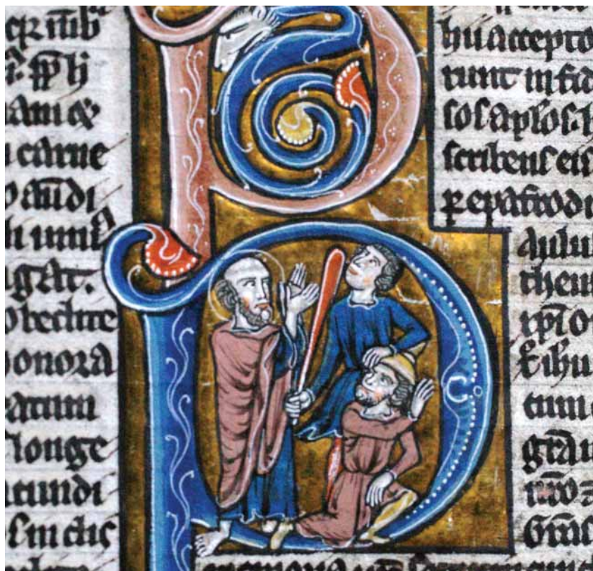
FIG.12 S. PAULO JUNTO A INDIVÍDUO COM BASTÃO E UM JUDEU. INICIAL "P" DA CARTA DE S. PAULO AOS FILIPENSES, BÍBLIA, LISBOA, BNP, ALC.455, FL.374

Na inicial historiada do início da Carta aos Filipenses Alc. 455 fl 374 (fig. 12), a interacção parece menos cordata. A cena representada mostra uma atitude de violência sobre um judeu que se encontra com um joelho por terra, dominado por outra figura que, segurando um bastão, exerce sobre ele violência física; tratar-se-á, de acordo com as ambiguidades do texto, de uma atitude de conforto, por parte de S. Paulo,