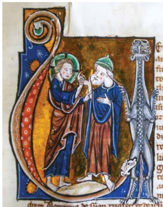
FIG.8 DEUS E AMÓS. INICIAL "V" DO LIVRO DE AMÓS, BÍBLIA, LISBOA, BNP, ALC.458, FL.262