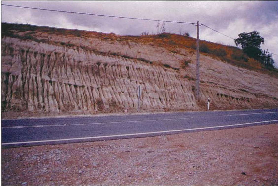
Foto 1 – Afloramento das Arcoses de Vilarça (o membro superior, exibindo cor esbranquiçada) e da Formação de Quintãs, em talude da EN102 na extremidade sul da depressão da Longroiva. Esta última formação, com cor alaranjada, assenta por descontinuidade sedimentar regional nas Arcoses de Vilarça. Ambas as formações se encontram basculadas para norte. O membro inferior das Arcoses de Vilarça aflora inferiormente ao patamar da estrada.