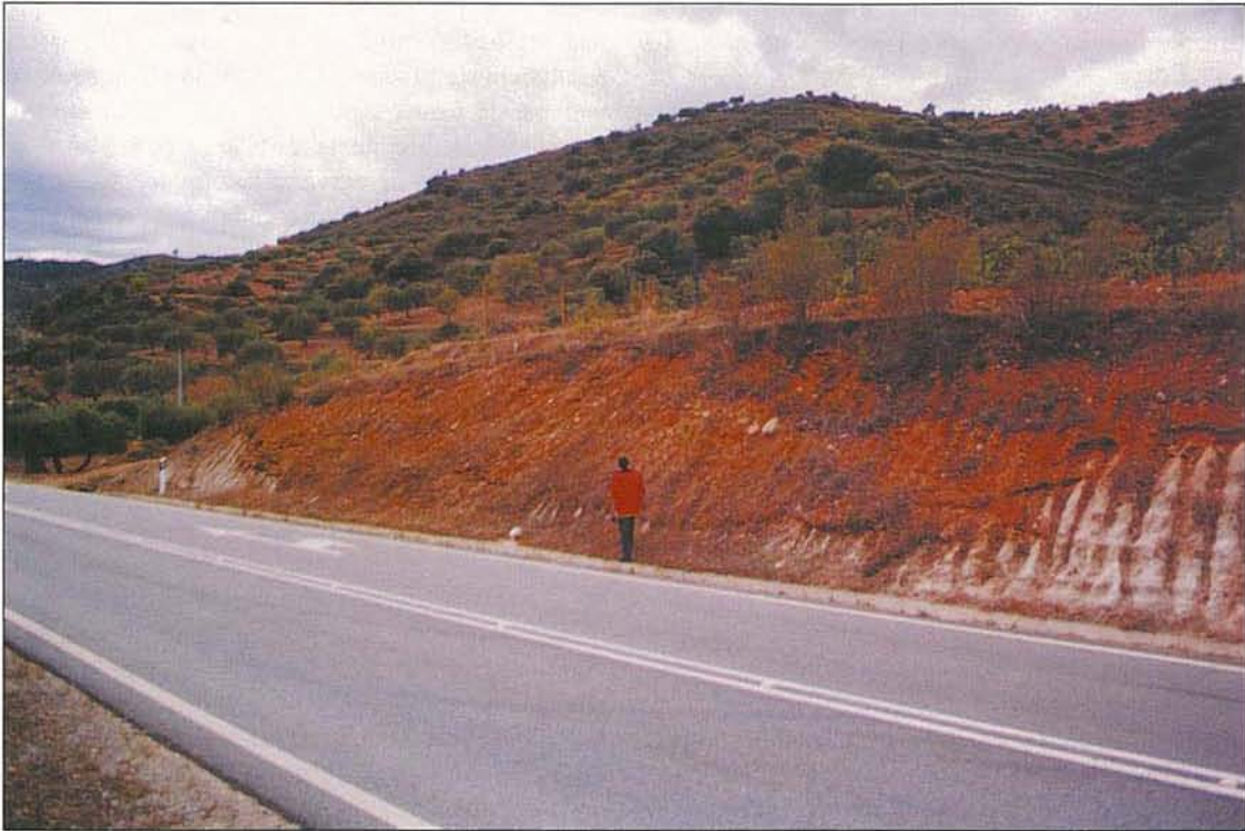
Foto 3 – Figuras de canal com forte declive e enchimento da Formação de Sampaio, ravinando as Arcoses de Vilariça; perto de Quintãs.