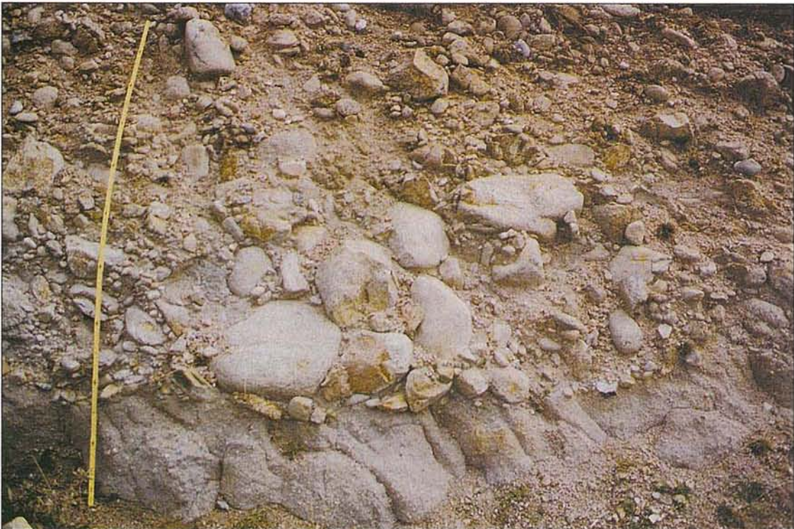
Foto 4 – Depósito de terraço conglomerático, apresentando grandes blocos rolados de granito lexiviado, ravinante sobre as Arcoses de Vilariça. Trata-se do mesmo local apresentado na foto 1. A régua mede 2 m.