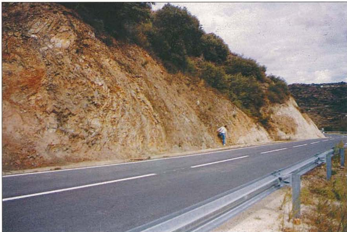
Foto 2 – Na estrada de acesso a Meda e Termas de Longroiva, o soco metassedimentar cavalga um conjunto arcósico que é constituído por arcoses alaranjadas grosseiras (Formação de Quintãs ?) que ravinam arcoses maciças esbranquiçadas (Arcoses de Vilarça). Ao fundo e à direita observa-se a depressão tectónica.