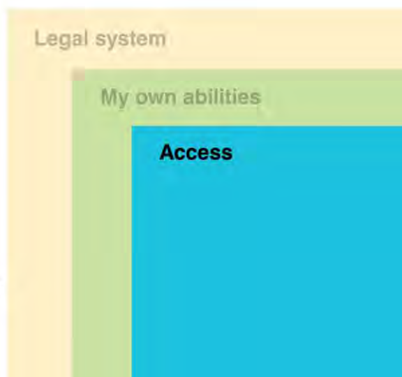
Taulukko 2: Viranomaisten toiminnan ymmärrettävyys, kuva: Pentagon Insight.

I have sometimes had difficulties understanding what the messages that I receive from authorities mean, what consequences they have or what I should do about them