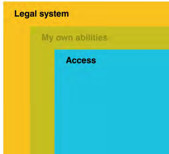
Taulukko 1: Luottamus oikeusjärjestelmään, kuva: Pentagon Insight.

54% The legal system guarantees all citizens equal opportunities to defend their rights